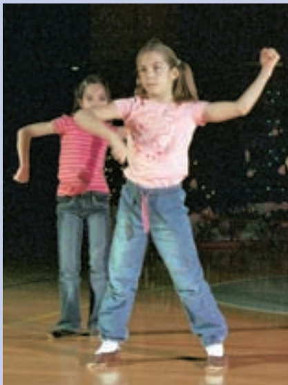
Plesalki iz skupine Hip hop, mala skupina, mladinci