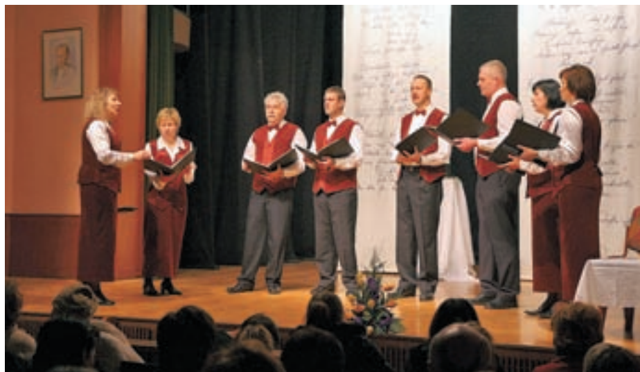
Oktet Lipa deluje od leta 1993, neguje pa predvsem slovensko ljudsko pesem.