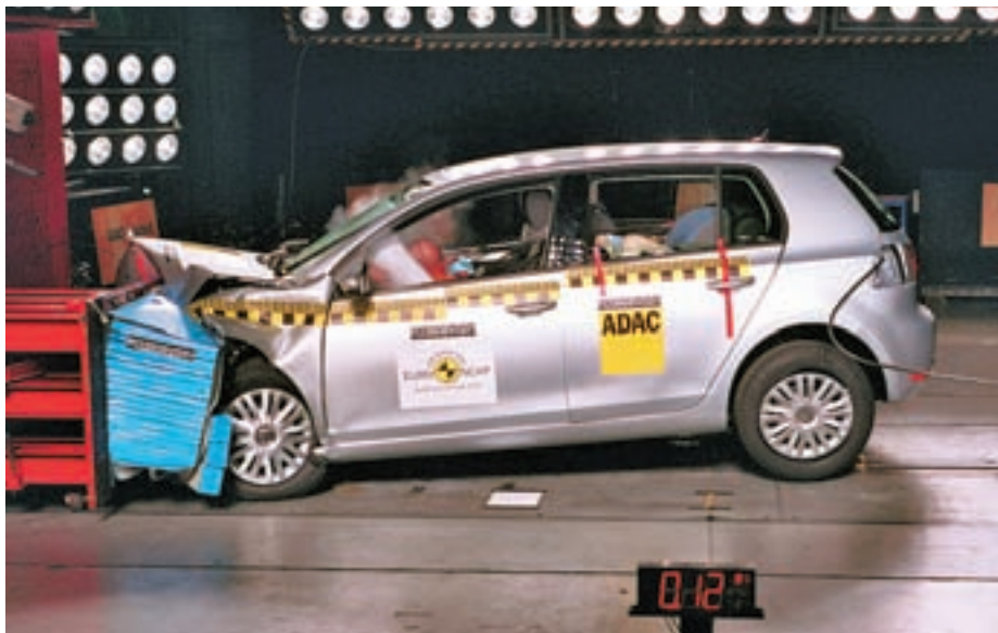
Na varnostnem preizkusu Euro NCAP je bil lani najboljši Volkswagen Golf.

Konzorcij Euro NCAP je lani sicer preizkusil varnost pri 33 avtomobilih. Skupna varnostna ocena posameznega modela je rezultat štirih preizkusnih trčenj, preizkusov posameznih komponent in zaključnega inšpekcijskega pregleda za potrditev rezultatov in preverjanja elementov varnostne opreme. Ker so bili lani zaostreni kriteriji za ocenjevanje, so se na varnostnem preizkusu znova znašli avtomobili, katerih varnost so ocenili že v letih 2007 in 2008 in so še v proizvodnji.