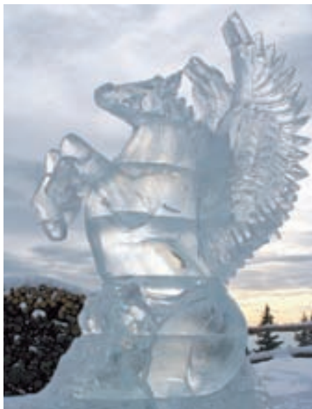
Pegaz na Krvavcu, visok 2,3 metra

skulpture iz testa in masla. Tako je bilo v začetku mojega kuharskega staža. Dejstvo pa je, da čeprav sem kuhar, ne maram imeti mastnih rok. To me moti. Prišel sem na idejo, da bi za takšne priložnosti skulpture oblikoval iz ledu. Pionir te zvrsti pri nas je Andrej Goljat. Na Brdo pri Kranju sem šel k njemu na tečaj, videl, kako deluje stroj, kako se dela led in se seznanil z osnovnimi tehnikami. To je bilo pred okrog petnajstimi leti. Osnovno znanje sem nato nadgrajeval z veliko praktičnega dela. Najprej sem vodo zamrzoval v navadnem kuhinjskem loncu s pomočjo gospodinjske skrinje, nato sem naredil že malce večji blok. Učenja je bilo okrog deset let, preden sem se kiparjenja v ledu lotil resno. Naredil sem svoj profesionalni stroj, s katerim lahko izdelam po