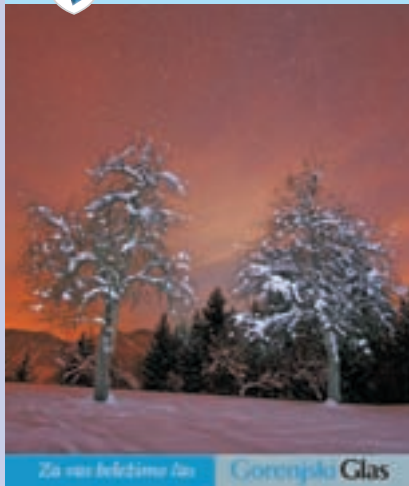
Za nas beležimo in Gorenjski Glas

Na naslovnici: Zimski večer, foto: Peter Košenina