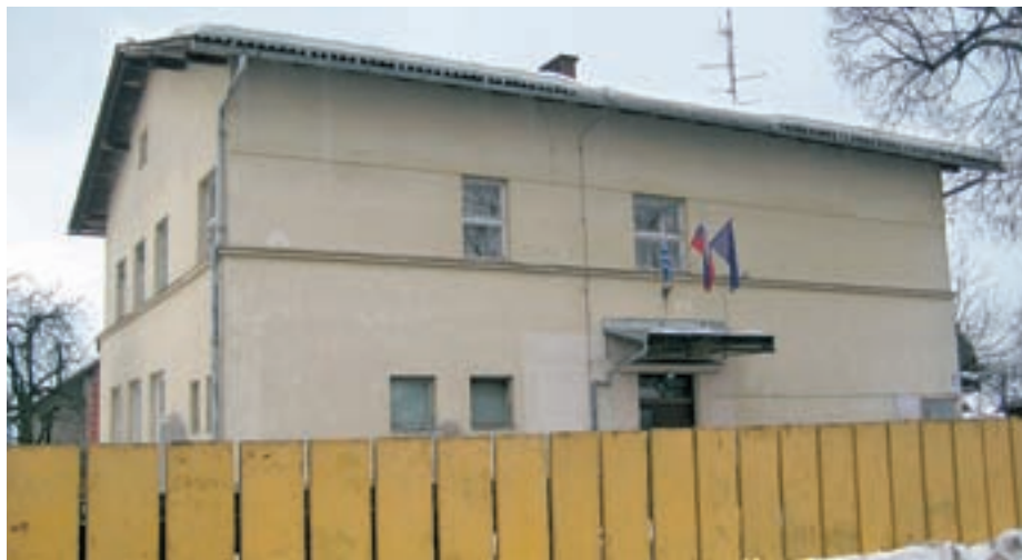
Objekt, v katerem je vrtec v Pirničah, je dotrajan. Občina načrtuje nov vrtec zgraditi pri osnovni šoli, zemljišče, na katerem je vrtec sedaj, pa prodati.

Večina svetnikov je menila, da gre za dve ločeni zadevi, ki bi ju bilo treba obravnavati in sprejemati posebej, zato so osnutek zavrnilo in sprejeli sklep, da občinska uprava pripravi dva ločena osnutka predloga, kot je predlagala tudi statutarno-pravna komisija, ki je imela več dilem. V odboru za okolje in prostor pa so imeli pomisleke tudi glede vprašanja, ali je tam urejena prometna situacija in da želijo dobiti po-