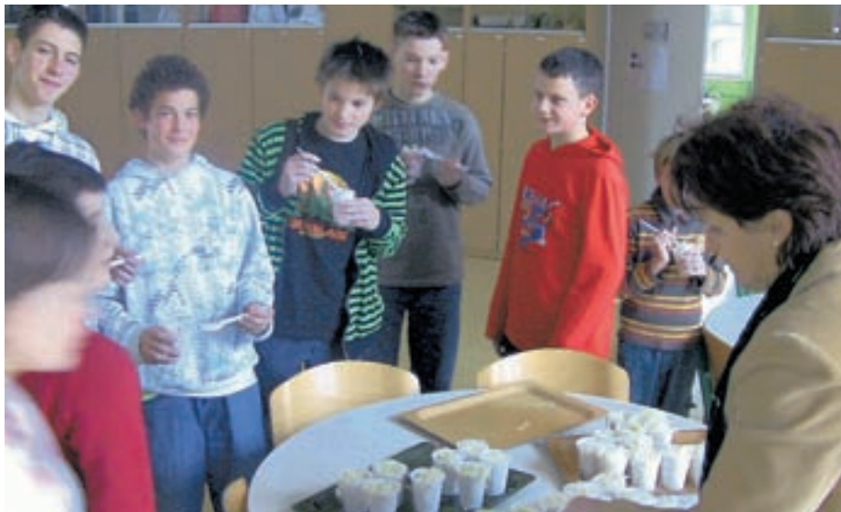
Minuli torek so smledniškimi učencem razdelili zelje.

Doslej so učencem razdelili šele štiri zdrave obroke: hruške, grozdje, korenje in zelje. "Čakamo na cenovno bolj ugoden trenutek, saj je sadje ta čas drago, mi pa bi otrokom radi omogočili čim več zdravih obrokov. Če bi jim na primer hoteli razdeliti ameriške borovnice, bi nas stale kar 600 evrov oz. polovico denarja, predvidenega za našo šolo. Razdeljevanje sadja in zelenjave bo tako bolj intenzivno potekalo februarja, mar-