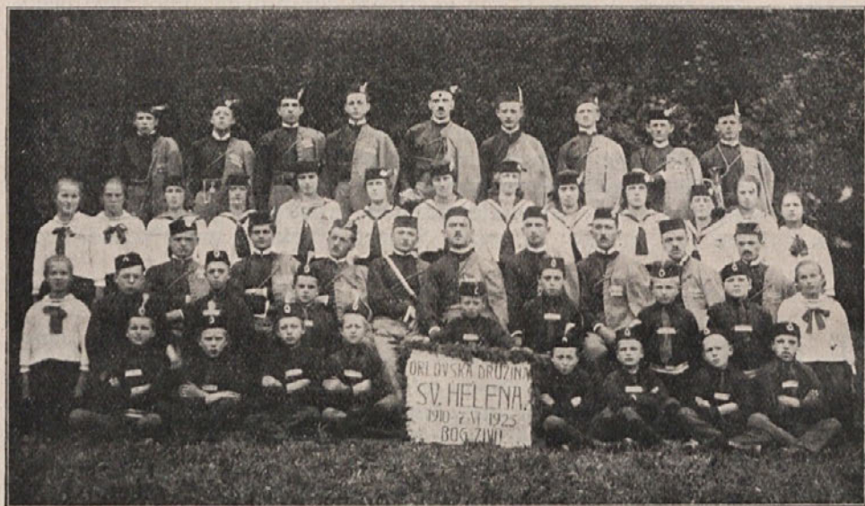
Orlovska družina pri Sv. Heleni