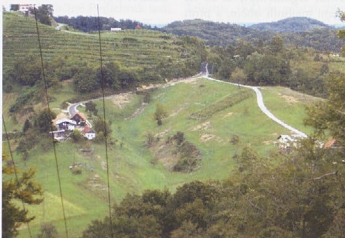
Asfaltiranje ceste Gorca (odcep nad Hrenovimi)-Dežno (Avtor I. Ban)

S projektom »Modernizacija in rekonstrukcija cest na območju naselja Ložine« smo uspeli na razpisu »Razvoj obmejnih območij s Hrvaško«, kjer smo prejeli sredstva v višini 500.000,00 EUR. Iz občinskega proračuna bo potrebno zagotoviti sredstva za pokritje DDV-ja v višini 100.000,00 EUR.