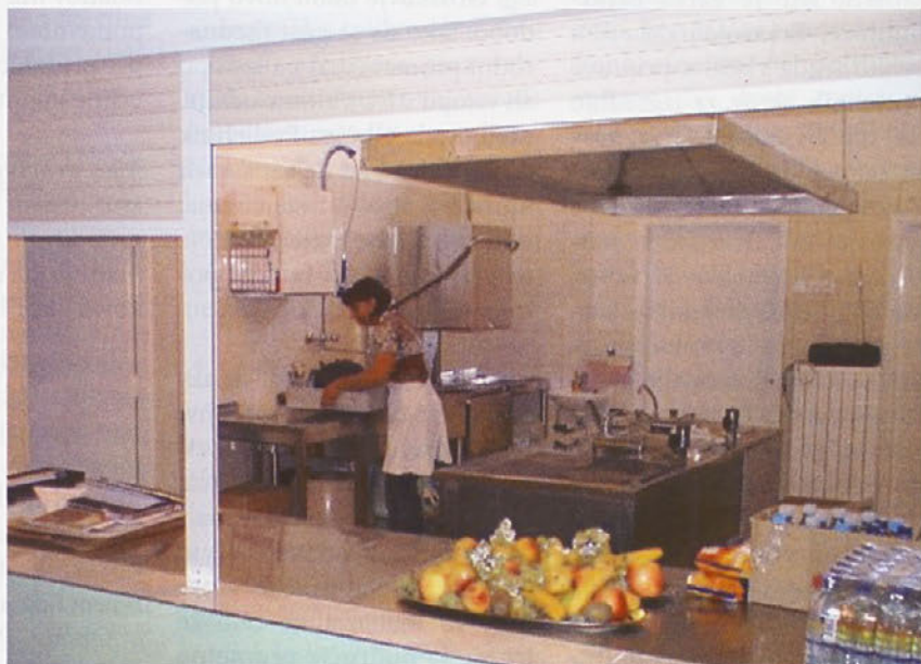
Prenovljena kuhinja v OŠ Podlehnik

V šolski avli je bil nameščen nov avtomat za vodo, ki ga je šola kupila iz lastnih sredstev. Učenci bodo tako imeli na voljo tudi pitno vodo iz avtomata. Finančni obseg izvedenih del in nabavljene opreme je znotraj predvidenih okvirjev, natančnejše številke pa bodo znane, ko bodo vsi izvajalci izstavili končne fakture.