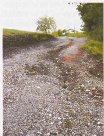
Cesta po neurju