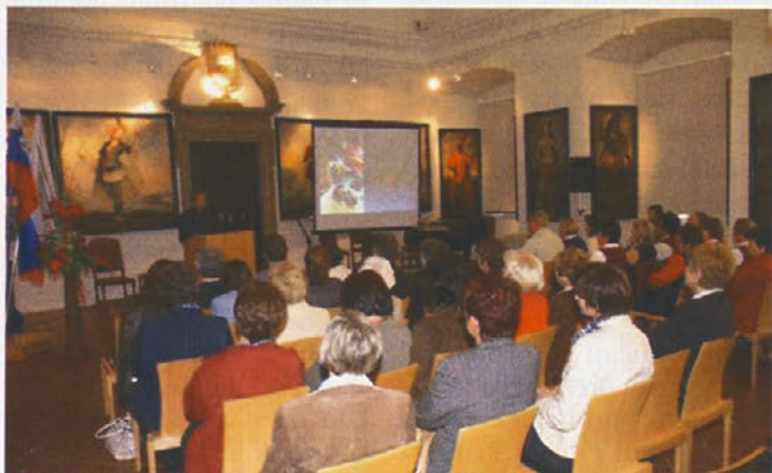
Premierna inavguracija knjige v viteški dvorani ptujskega gradu

... Po tem obredu sta gospodinja in gospodar berače povabila na obilno večerjo, ... , na kateri ni smela manjkati pljučna kislina in orehova potica. Berači so se veselili pozno v noč, prepevali, včasih tudi plesali ... (str. 63)