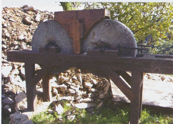
Haloški mlinci bolj počasi meljejo...

»življenja na zemlji in od zemlje« je s tem porušen ali vsaj bistveno popačen. Dogajanje se nam pred našimi očmi posledično zrcali v nepokošenih in čedalje bolj zaraščenih in neprehodnih površinah, opuščenih poljih, izkrčenih vinogradih. Namesto koscev (ki bi jih sicer bilo zares težko najti), ki bi že ob prvem svitu mesece in mesece dolgo vihteli nabrušene kose, opazimo na mnogih strminah novodobne kosce – ovce in koze, ki še na dokaj zadovoljiv način čistijo senožeti in zašiljena košeninska pobočja haloškega sveta. V zameno za marsikateri žulj od delovnih orodij pa imajo sedaj ljudje čas za prelistavanje vsakodnevnih novih reklamnih sporočil, ki neutrudno polnijo naše poštna nabiralnike. Gorje mu, ki nima velikega nabiralnika, dvakrat gorje (in grožnja s položnico), če ga sploh (še) nima!