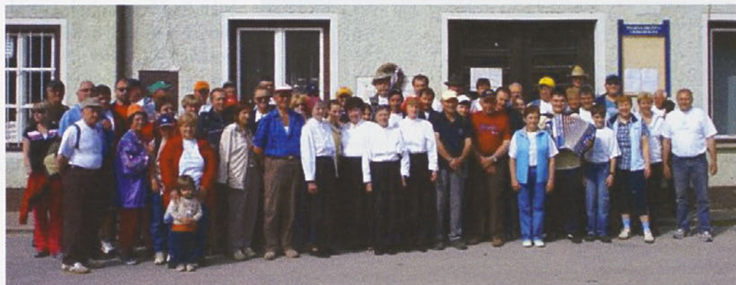
Se ne najdeš? Potem si zamudil ali pa te sploh ni bilo na pohod!