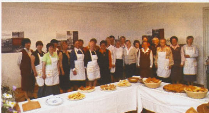
Članice DPŽ Podlehnik ob predstavitvi dobrot na ptujskem gradu

Da ne bodo odšli v pozabo tipični domači izrazi, ki so se, ali se še uporabljajo v naših krajih za določena opravila, šege in jedi, so številni izrazi ter pojmi zapisani tako v standardnem (knjižnem) jeziku kakor tudi v dialektu krajev Občine Podlehnik (npr. praženec, pečen v pečici - šmorn, pečen v protroli). Če se bralec ne bi znašel med domačimi izrazi, je ob koncu knjige zapišani tudi slovarček ca. 150 domačih izrazov z ob-