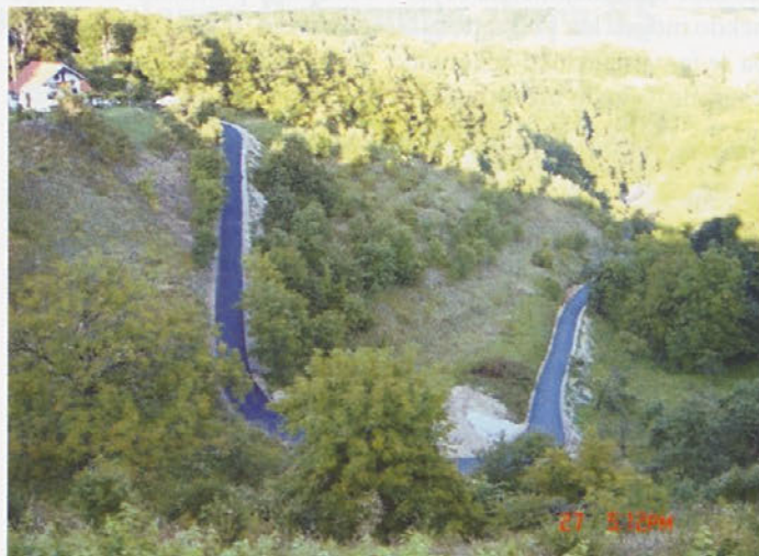
Asfaltiranje ceste v strmi klanec mimo Gosakovih v Gorci

V poletnih mesecih sta bila asfaltirana dva nova odseka cest, in sicer odsek Gorca (odcep nad Hrenovimi)-Dežno v dolžini 1,1 kilometra in dobrega pol kilometra dolg odsek ceste v strm klanec mimo Gosakovih v Gorci. Modernizacija je potekala ob izdatni pomoči občanov in lastnikov zemljišč oz.