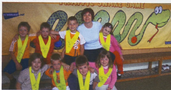
Izvajanje igre Prometna kača – 1 razred OŠ Podlehnik

Zahvala tudi Občini Podlehnik in županu g. Marku Maučiču, ki je od vsega začetka podpiral vključitev podlehniške osnovne šole v projekt.