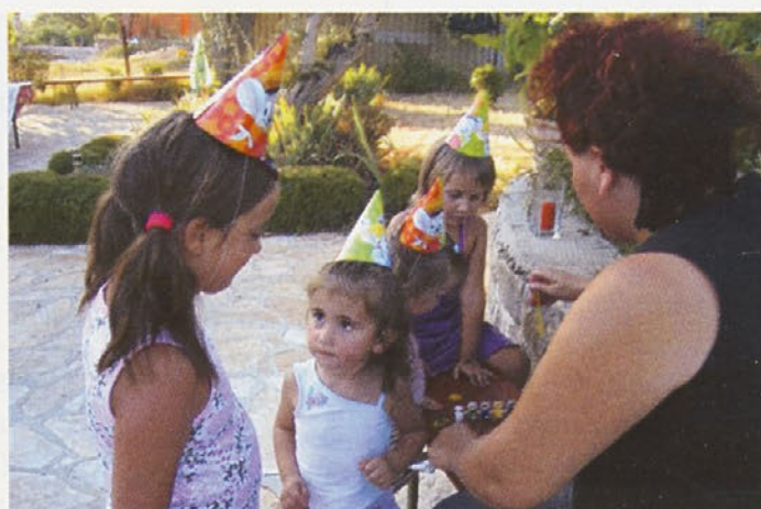
Kids Birthday Party in Dalmatia