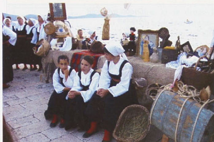
Ajde mila čeri moja, zapivaj si pismu o mornarju