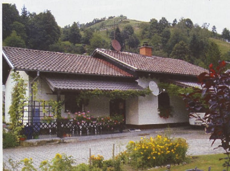
Ana in Maksimiljan Rotar iz Stanošine 5