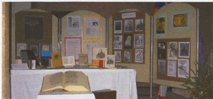
Utrinek z razstave v veži na Lahovem. V ospredju Dalmatinova Biblija (temeljno delo slovenske književnosti), iz knjižne zbirke družine Ban

V prostorih stare preše so prireditelji pripravili lepo tematsko razstavo Trubarjevih del, portretov in fotografij. Slavnostna prireditev pa se je v kleti odvijala ob svečah in baklah, saj v zidnici ni elektrike. Vzdušje je bilo zares enkratno. K temu so z umetniško izvedenim programom pripomogli vsi nastopajoči. Vse – scena, program, razsvetljava in razstava – je bilo deležno velike pohvale, za pogostitev pa so poskrbeli domači vinogradniki, ki so nam v pokušnjo ponudili izvrstna haloška vina. Res lahko rečemo, da smo tokrat Podlehničani združili moči in pokazali, kaj znamo in zmoremo narediti.