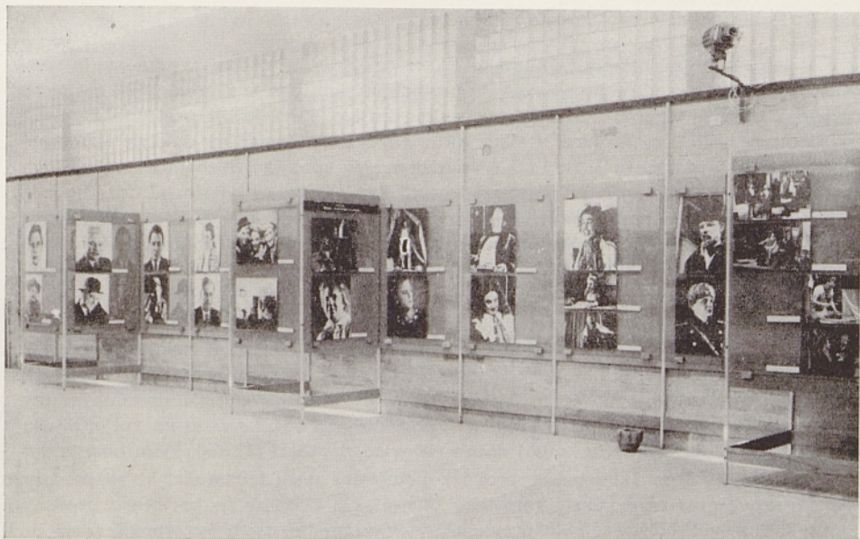
Pogled na del Severjeve razstave v Škofji Loki (18. decembra 1971)