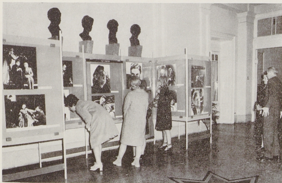
Del Severjeve razstave v Mariboru (ob Boršnikovem srečanju 1971)