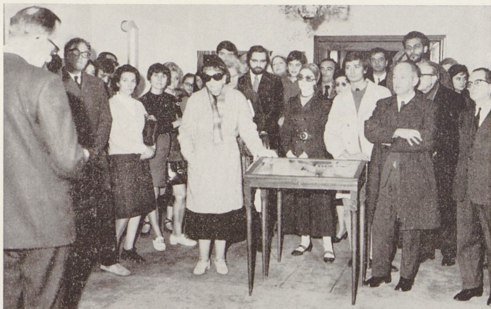
Ob otvoritvi razstave Bojana Stupice v Beogradu (18. novembra 1971)