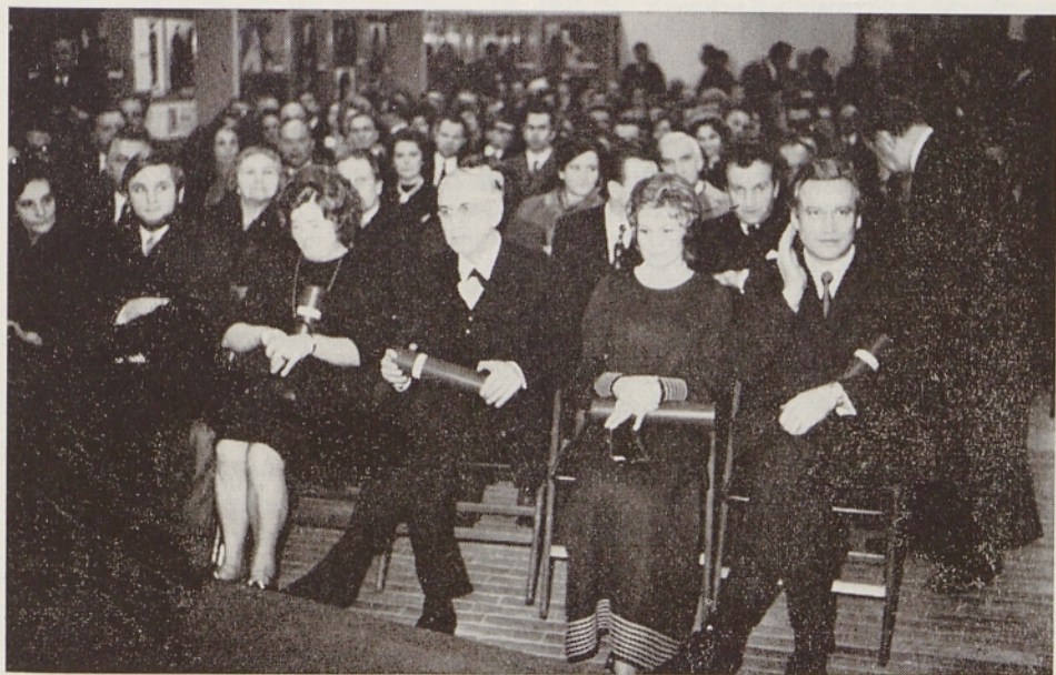
Prvi Severjevi nagrajenci (Škofja Loka 1971)