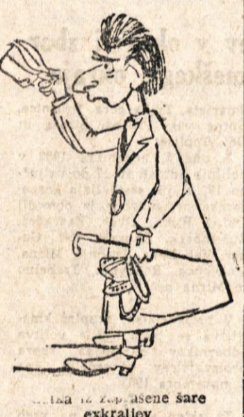
... in tu tovariš, vzalga ekstraljev

Nesporazum Francoski slikar Camille Roqueplan (1802 — 1855) je nekoč poklical izvozičnika, ki je imel vpraženo zelo klavno kljuje. Ko ga je vprašal, koliko bo računal za vožnjo do Vincennesa, se je košičaj odrezal prav moško: »Sedem frankov, pa greva!« Slikearja je pograbila jeza zaradi pretirane zahtev, pa se je otrekel odreženju voznika s posjasilom: »Prijatelj, menda si nisva razumela? Saj vas nisem vprašal, koliko hočete za kljuje!