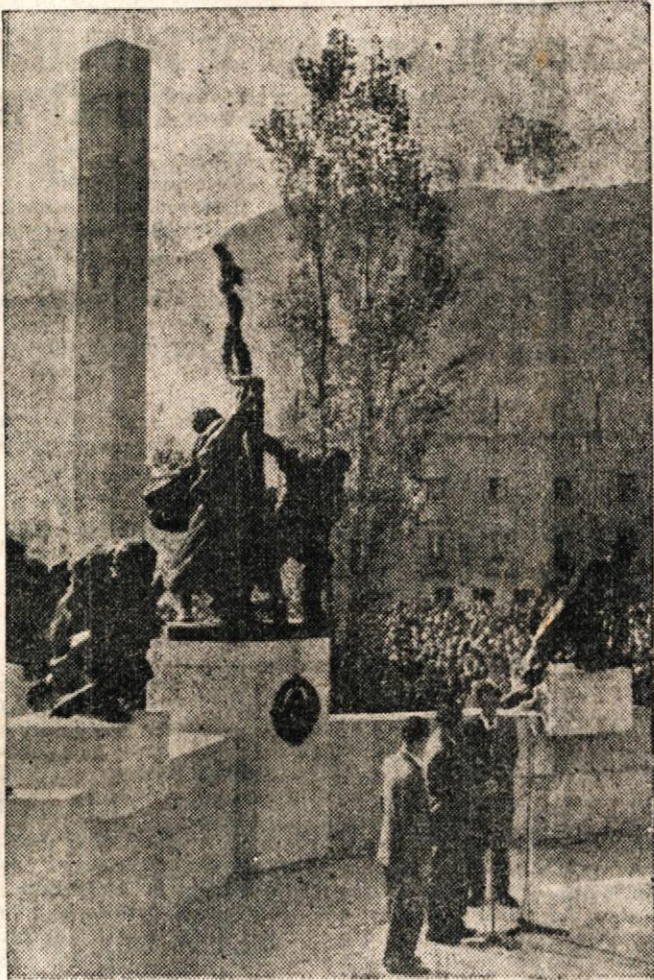
Podpredsednik Edvard Kardelj govori ob odkritju spomenika v Kočevju