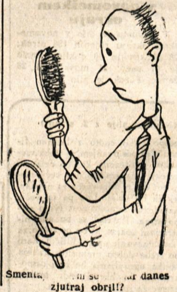
Smetič, ... danes zjutraj obril!

»Matematika, dragi tovariš, je najzanimivejša med vsemi vedami in dovoljuje najčudovitejše kombinacije. Tako vzamem na primer svojo rojstno letnico, jo delim s številko svojega telefona in pridem tako do starosti svoje žene.