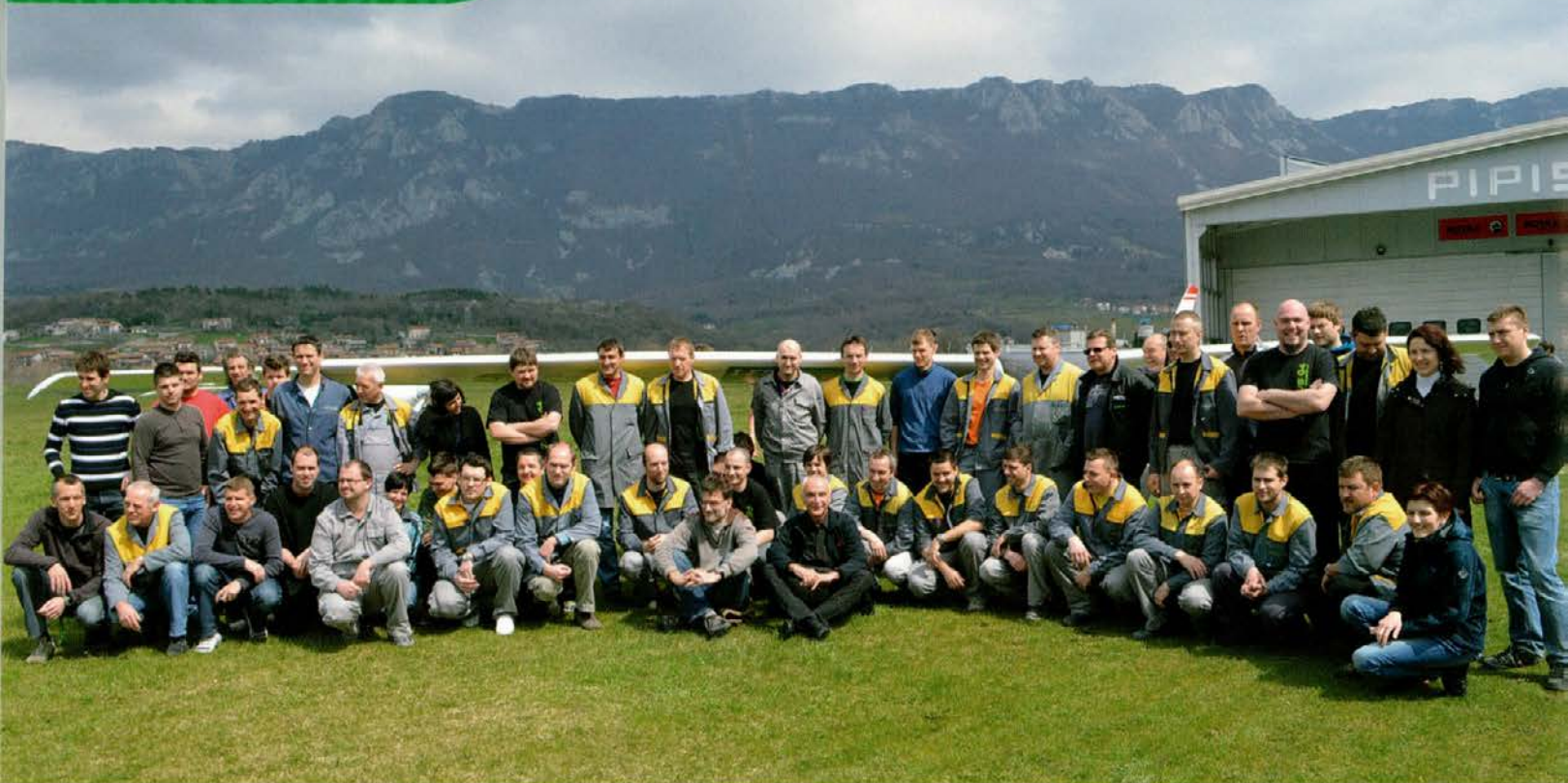
Pipistrelova ekipa, ki je "bdela" nad poletom.