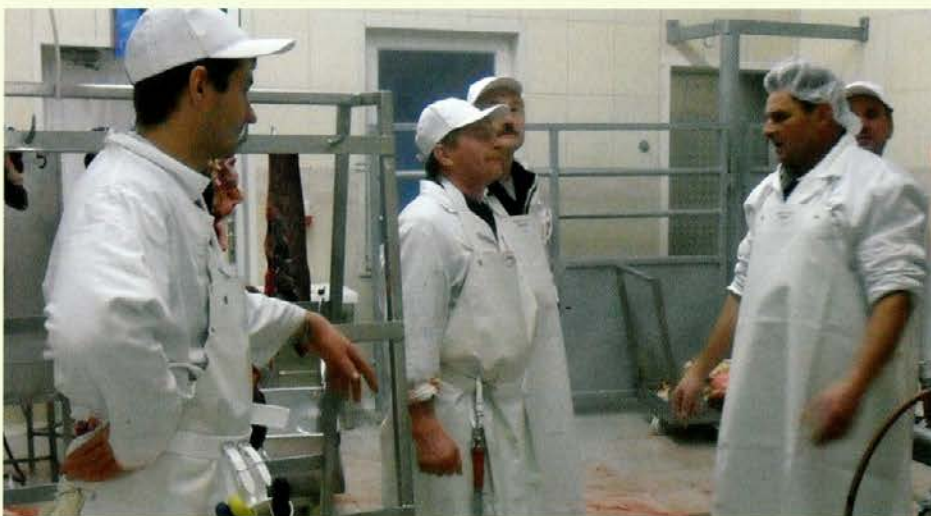
Po opravljenem prvem zakolu