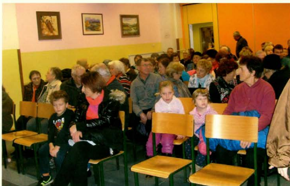
Dvorana se je napolnila

Udeležba na koncertu je bila brezplačna, darovane prostovoljne prispevke pa bodo polžki namenili za izvajanje preventivnih zdravstvenih programov ter promocije zdravega načina življenja.