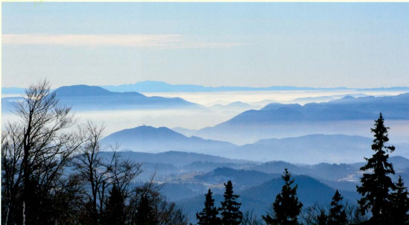
Pogled s Kop

Decembrski informativni gozdarski storži so bolj birokratski in manj terensko