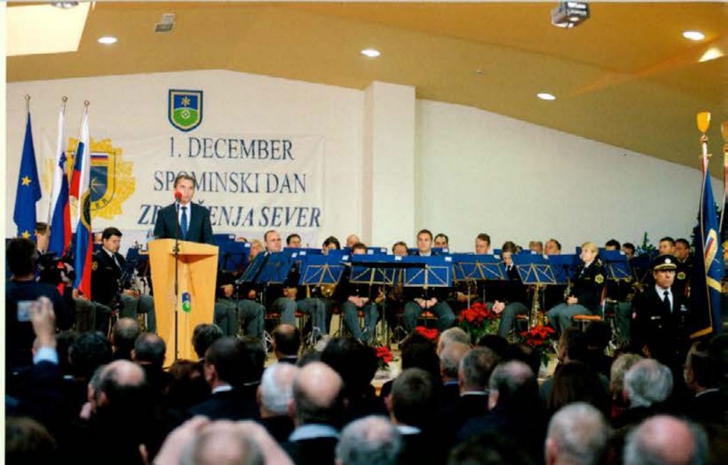
Proslava v Mislinji

Takrat je minilo 24 let od napovedanega mitinga resnice v Ljubljani, dogodka, ki bi lahko vodil v izredne razmere zaradi destabilizacije slovenske politike in ustvarjanja dvoma v javnosti, za posledico pa bi lahko imel vnovičen podrejen odnos do takratne jugoslovanske centralistične in hegemonistične politike, in to samo zato, ker je bil slovenski družbenopolitični in kulturni prostor od ostalih takratnih republik že mnogo bolj razgiban in živahen. Slovenski prostor se je že takrat učil dihati demokratično in pluralno. Zaradi enotnosti slovenskega političnega vodstva in vsega slovenskega ljudstva, izredne profesionalnosti takratne milice in akcije, poimenovane Sever, je ideja propadla. Mitingu resnice je bilo enotno in odločno rečeno ne. Mitinga ni bilo, Sever je ostal in obstal.