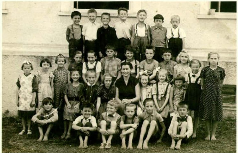
Fotografije iz prvega razreda nimamo, ta je iz drugega, podatki pa izvirajo iz šolske kronike.

Kramljanje je trajalo pozno v noč, najbolj zanimivo je bilo poslušati razna doživetja izpred 50 let. Predvsem pa je bil prisoten spomin na preminule sošolce, ki smo jih počastili z minuto molka, jim v spomin prižgali sveče in se jim poklonili. Ob koncu smo se dogovorili, da naj bo ponovno srečanje vsaki dve leti in da naj ostane dosedanji odbor.