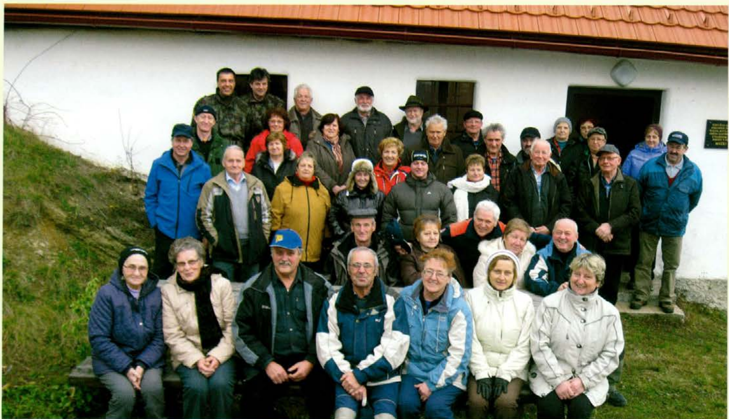
Udeleženci slovesnosti iz Mislinje pred muzejem NOB na Pustovi domačiji

Del borcev Pohorskega bataljona, ki na dan borbe pri Treh žebljih niso bili v taboru, je padel kasneje po izdajstvu v Završah nad Mislinjo.