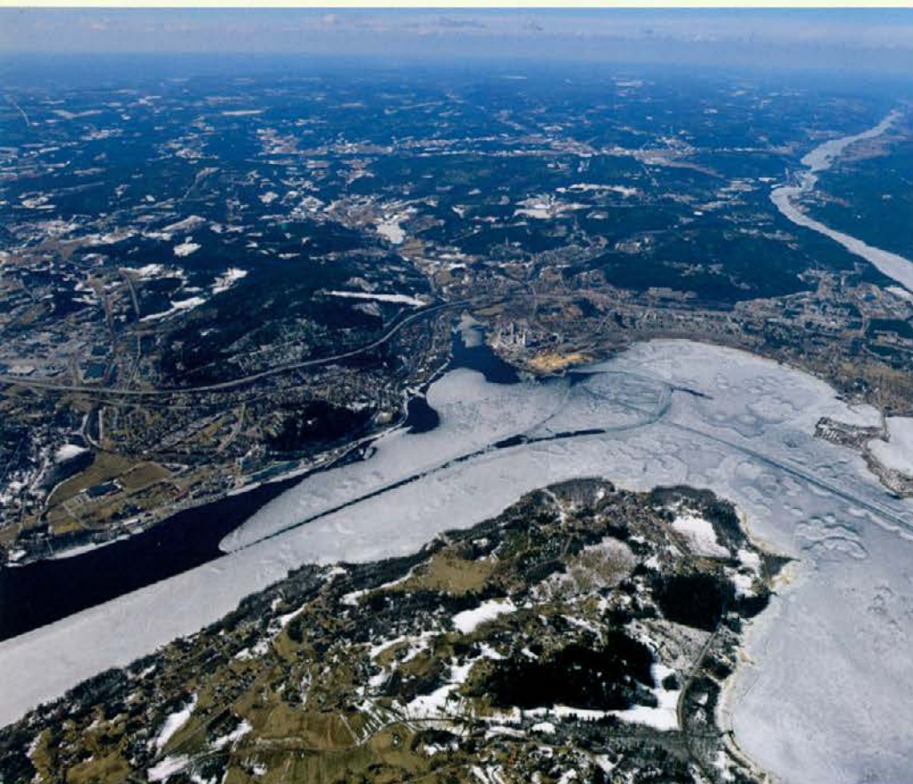
Nad Švedsko

bi ga oblasti zaprle, letalo pa zasegle. Imel pa je dobro ekipo, ki mu je to pomagala urejati, a tudi na terenu so se vedno našli entuziasti, ki so radi priskočili na pomoč.