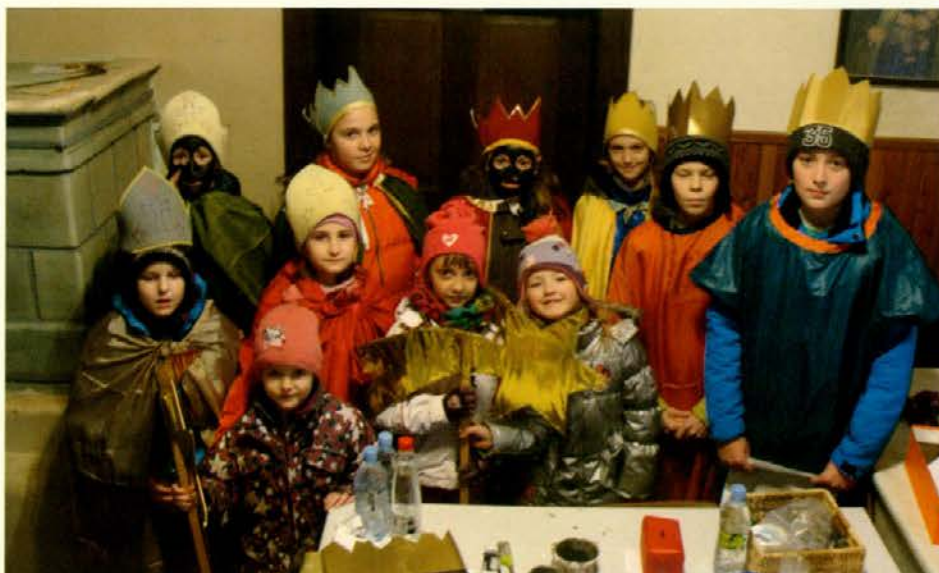
Sveti trije kralji s svojim spremstvom pred začetkom koledovanja

S svojimi obhodi so s pesmijo in lepim voščilom združevali vas v skupnem prazniku. Po končanih obhodi pa so