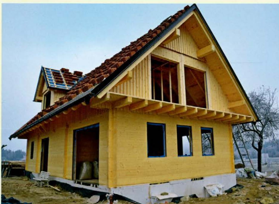
"Šikana" hiša v Tomaški vasi

Otrokom je hiša všeč. Pravijo, da je "šikana".