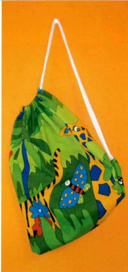
Vreča za copate

Smisel zadruge Dobrote je v tem, da zaposlujejo iskalce prve zaposlitve in osebe, starejše od 50 let, ki so predhodno izgubile službo. So tudi ekološko osveščeni, saj vse preveč tekstila konča na smetiščih, kjer gre v nič. V ta namen so po celotni koroški postavili zaboynike za zbiranje tekstila, ki ga ljudje ne potrebujejo več. Tega potem predelajo v najrazličnejše izdelke. Zaboynike so postavili tudi v Velenju, na Dobrni, v Ljubljani in na Vrhniki in lahko rečejo, da so ljudje projekt lepo sprejeli in da radi sodelujejo. Tekstil, čevlje in igrače pa lahko ljudje dostavijo tudi osebno na