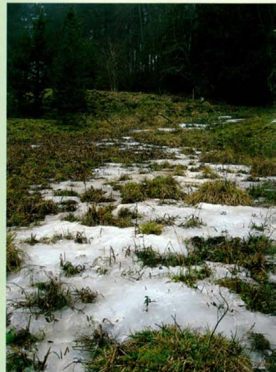
Na nicini je konec decembra kipela in zmrznila talna voda.

December ali gruden naj bi bil najbolj veseli mesec v letu. Z njim zaključujemo leto, se spominjamo lepih in grdih stvari, ki so se zgodile. 25. decembra praznujemo božič, 26. decembra imamo državni praznik – dan samostojnosti in enotnosti. Najbolj živahno je ob prehodu starega leta v novo leto. Za božič in silvestrovo (31. december) si zaželimo vse najboljše, predvsem pa zdravja. Poleg omenjenih najbolj pogostih želja konec lanskega decembra so bile izgovorjene tudi želje, da leto 2014 ne bi bilo več tako krizno. Veliko nemirnih in neprijetnih dogodkov se je zgodilo v letu 2013, pestro pa je bilo tudi na gozdarskem področju. V decembru nam je prizaneslo vsaj vreme. V začetku decembra 2012 smo se tudi v dolini bili primorani razgibavati z lopatami za čiščenje snega. V decembru 2013 ta oblika rekreacije ni bila potrebna, razen v višjih predelih. V decembru 2013