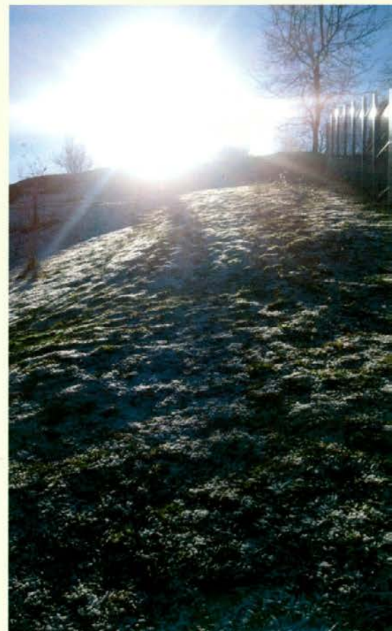
Nezimski idila na začetku decembra

V novembrskih informativnih gozdarskih storžih sem obvestil lastnike gozdov, ki so izvajali gojitvena in varstvena dela v letu 2013, da bo nakazilo sofinanciranih izvedenih gozdnogojitvenih in varstvenih del, obračunanih v zadnjem zahtevku, izvedeno še v decembru. To se ni zgodilo. Vsi lastniki gozda, ki so imeli obračunana dela v tem zahtevku, so dobili denar na svoj transakcijski račun 6. januarja 2014. Izplačana denarna sredstva ne bremenijo letošnjih proračunskih sredstev za vlaganje v gozdove, temveč lanska. Lastniki so dobili manjši znesek od obračunanega zaradi izplačila akontacije dohodnine. ZGS je v skladu z Zakonom o davčnem postopku kot izplačevalec sredstev za vlaganja v gozdove ob nakazilu izračunal in odtegnil akontacijo dohodnine. Ta znaša za rezidente, ki so prejeli nakazilo, večje od 200 EUR, 10 % od davčne osnove. Akontacija ni bila odtegnjena, če je bilo nakazilo enako ali manjše od 200 EUR. V letu 2014 je davčna osnova enaka dohodku, dohodek pa je vrednost dela in vrednost materiala skupaj. Obnova ni obdavčena.