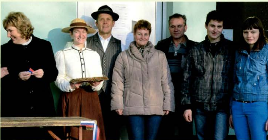
Družina Naveršnik ob odprtju