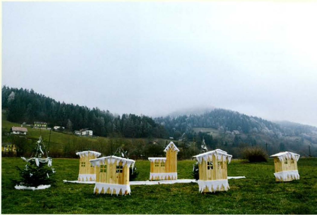
V Šentjanžu pri Dravogradu je čez zimo zrasla nova vasica ...

Veste, kateri kraj je bil za božično-novoletne praznike takole okrašen? Da, Dravograd. In tudi tam je Dedek Mraz razveseljeval najmlajše.