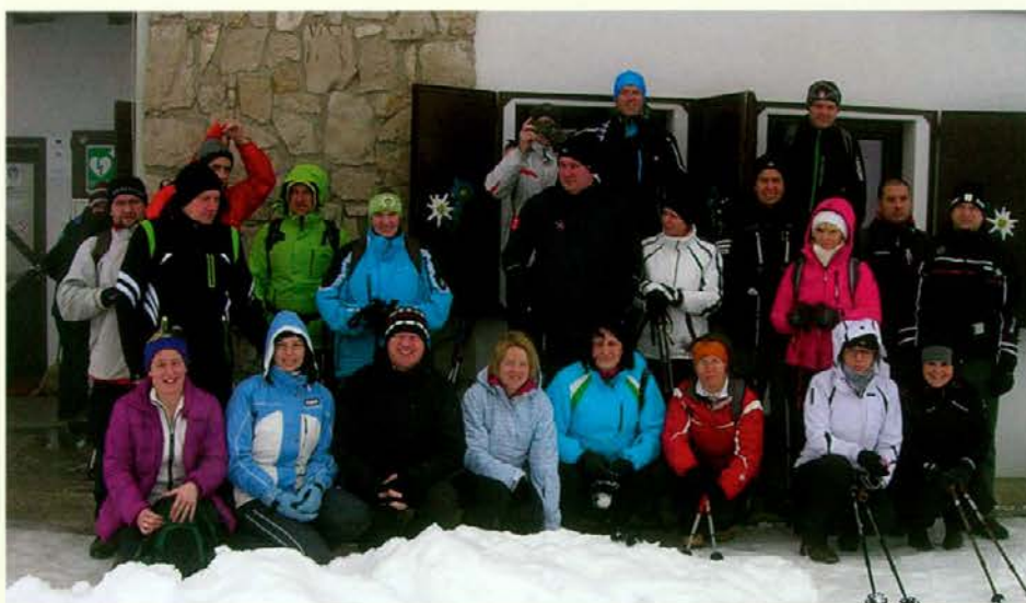
Še fotografiranje pred Domom na Uršlji gori in hajd domov

Ni ga lepšega, kot je vstop v prijetno toplo izbo v Domu na Uršlji gori, ki mu sledi malica iz nahrbtnika ali še bolje iz tamkajšnje kuhinje, od koder vedno