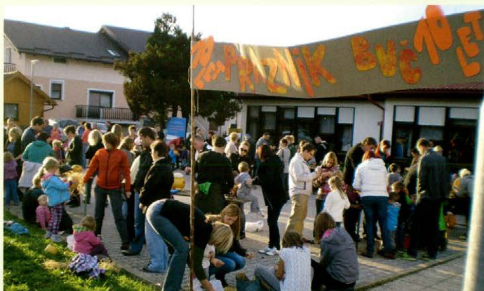
Taka druženja so res prijetna