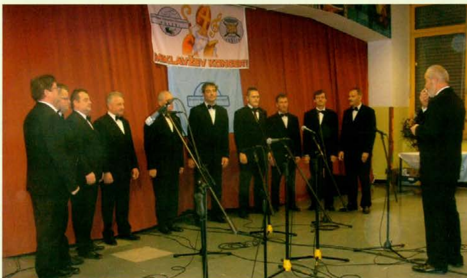
Moški pevski zbor Štefan Goršek – Čaki