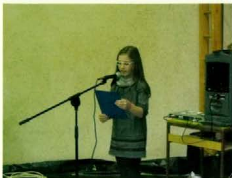
Prireditev je suvereno povezovala mlada voditeljica.