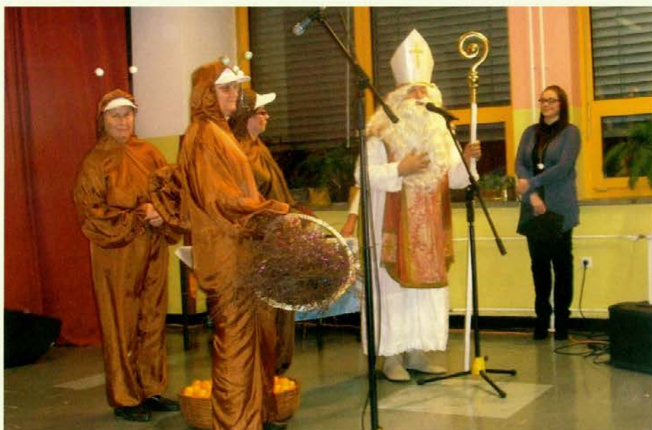
Miklavž s polžki