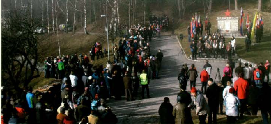
Zagotovo se zberemo na Sv. Primožu tudi prihodnje leto!