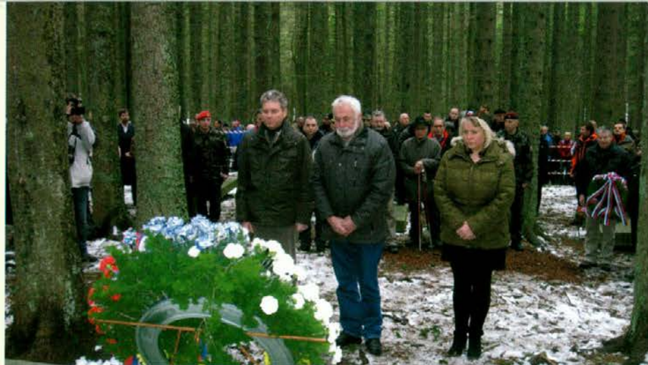
Delegacija Občine Mislinja polaga spominski venec ob spomeniku.