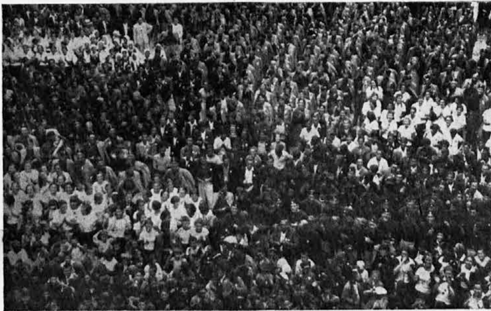
Sa veličanstvenog zbora Sokolstva u Splitu, održanog 4 o. m. u proslavu 20-godišnjice Jugoslavije

Kad svaka od preko 2000 sokolskih jedinica i svaka od skoro 300.000 sokolskih jedinica za ove tri godine podigne samo po nekoliko blagorodnih voćaka i po koju desetinu šumskih sadnica, a da ne pominjemo ostale mnoge lepe, veće i manje poslove, preći ćemo uspešno put i stići visokome cilju. A kad stignemo visokome cilju sagledaćemo ceo rezultat zajedničkih napora na prostranome vidiku: bezbrojne zazelele površine, gde je bila golet i puštoš, mnoge divne voćnjake i vinograde, mnoge mlade šume, Petrove gajeve, mnoga mesta, gde ne beše ni kaplje vode, sa zdravom i bistrom pijaćom vodom koja bje iz stanca kamena i čućemo pesme oko izvora; sagledaćemo mnoge nove i lepe sokolske domove, vežbaonice i vežbališta u zelenilu i u njima bezbroj sokolske mladeži, vese-