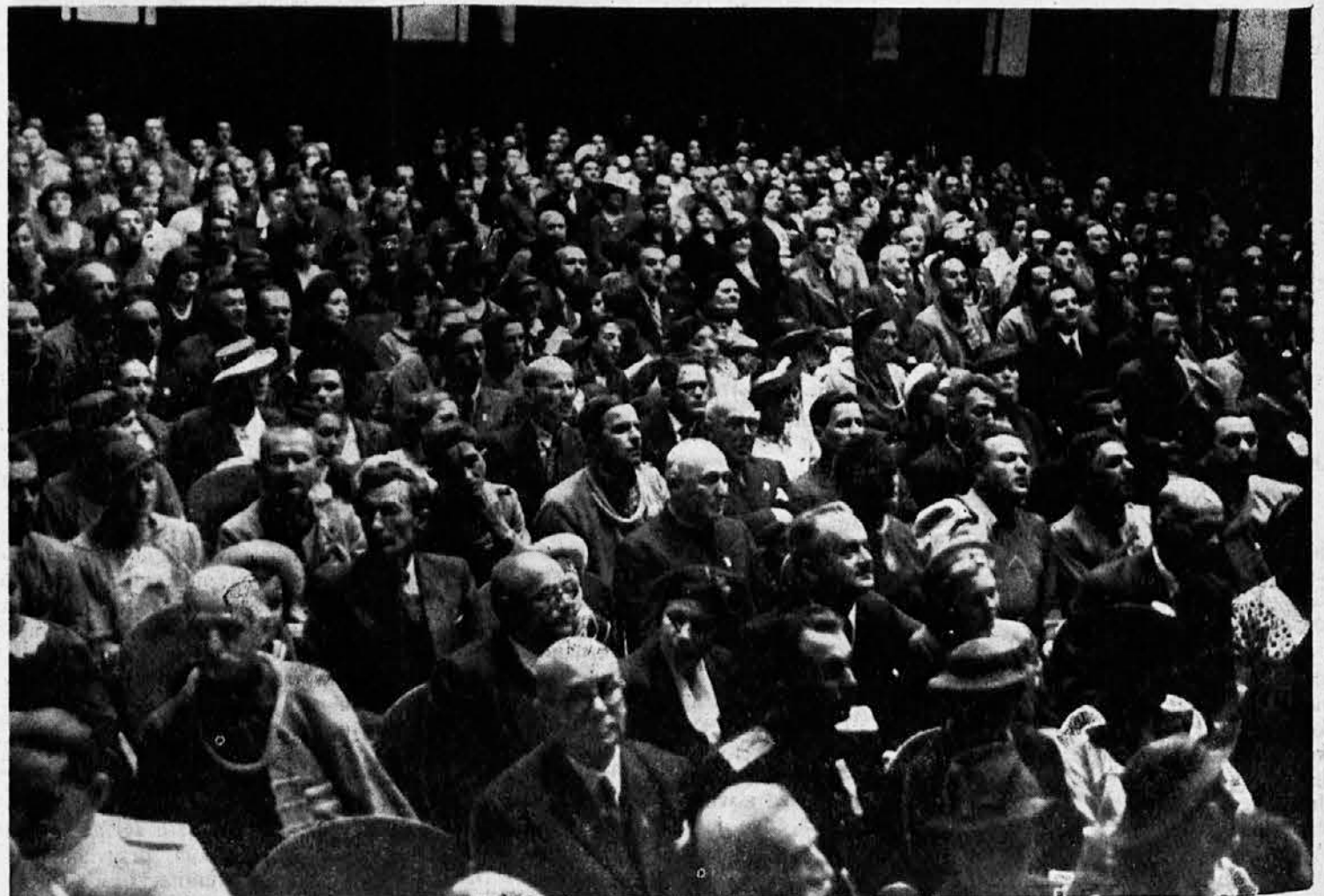
Gradanstvo i delegati sokolskih jedinica iz cele zemlje prisustvovali su svečanoj sokolskoj proslavi rođendana Nj. Vel. Kralja na Kolarčevom univerzitetu u Beogradu

Posle toga upućen je Nj. V. Kralju sledeći telegrafski pozdrav: