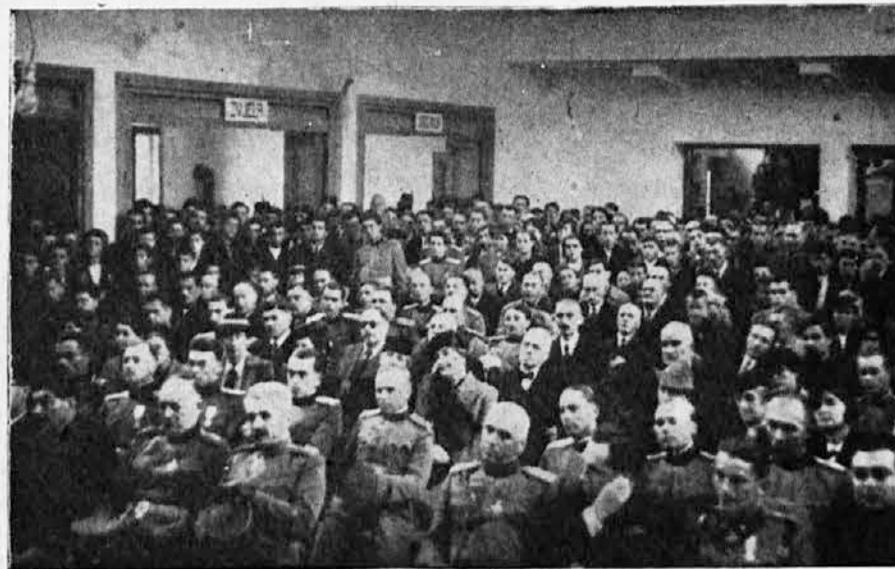
Proslava rođendana Nj. Vel. Kralja u Gospiću Snimak sa svečane sednice sokolskog društva

Na kraju svečanosti, uz ponovno i dugo klicanje Nj. V. Kralju sokolski hor i svi prisutni zajedno otpievali su „Hej Sloveni!“. Time je svečanost završena, a Sokoli u istom poretku kao što su i došli, otpratili su svoje zastave do Sokolskog saveza, pozdravljeni usput od građanstva.