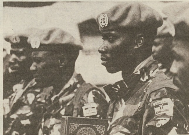
Vojniki iz Kenije v vrstah OZN

»Strani sta dve, zato imam dve skupini opazovalcev,« je dejal Mackenzie. »Eno na srbski strani, drugo na strani predsedstva. Med seboj nimata nobenih stikov. Fizično sta ločeni in njihovim članom je prepovedano vsako druženje. Poleg mene samo še dva človeka vesta, na katerih položajih je topništvo. To je najbolj skrbno varovan podatek, ker samo popoln molk zagotavlja varnost mojih ljudi in uspešnost operacije.« (STA)