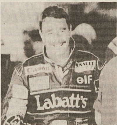
Nigel Mansell korak od naslova

Poglavje zase je Ferrari. Nedeljska dirka je bila že šesta, na kateri Maranellovi bolidi niso osvojili niti točke, že tretjič pa je Alesija zaustavila banalna okvara protipožarne naprave! Skratka, italijanska hiša se je resnično dotaknila dna. Njen zaostanek je zdaj takšen, da ni realno pričakovati, da bi se na noge postavila v eni sami sezoni, zato pa tudi