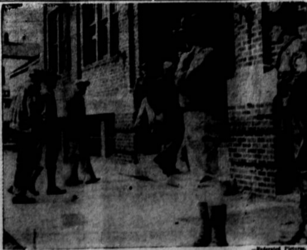
Skupina upornih farmarjev v Iowa aretiranih po milici.

Ženeva, 13. maja. — Liga narodov ima, odkar obstoji, opraviti s prvo legalno vojno, ko je južnoameriška republika Paragvaj uradno napovedala vojno svoji sosedi Boliviji. Svet Lige narodov je bil sklican v izredno sejo. Bolivija je obvestila Ligo, da je Paragvaj prelomila ustavo Lige. Liga mora zdaj izvajati sankcije.