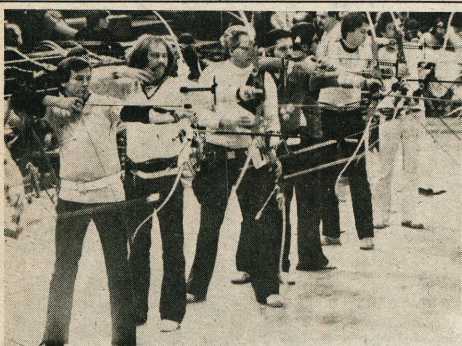
Člani na tekmovalni črti

KAMNIŠKI OBČAN, glasilo občinske konference SZDL Kamnik – Kamniški občan je aprila 1981 ob 20-letnici izhajanja prejel srebrni znak OF – Ureja uredniški odbor – glavna in odgovorna urednica Jana Taškar – tehnični urednik Franc Mihavec – strokovna sodelavka Vera Mejač – Izhaja dvakrat mesečno – Naslov uredništva: Kamnik, Tomšičeva 2, telefon 831-311 – tekoči račun pri OK SZDL 50140-678-57039 – Kamniški občan – Rokopisov in fotografij ne vračamo – Tiska CGP Delo v Ljubljani.