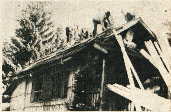
Stahoviški lovci pri delu na lovski koči