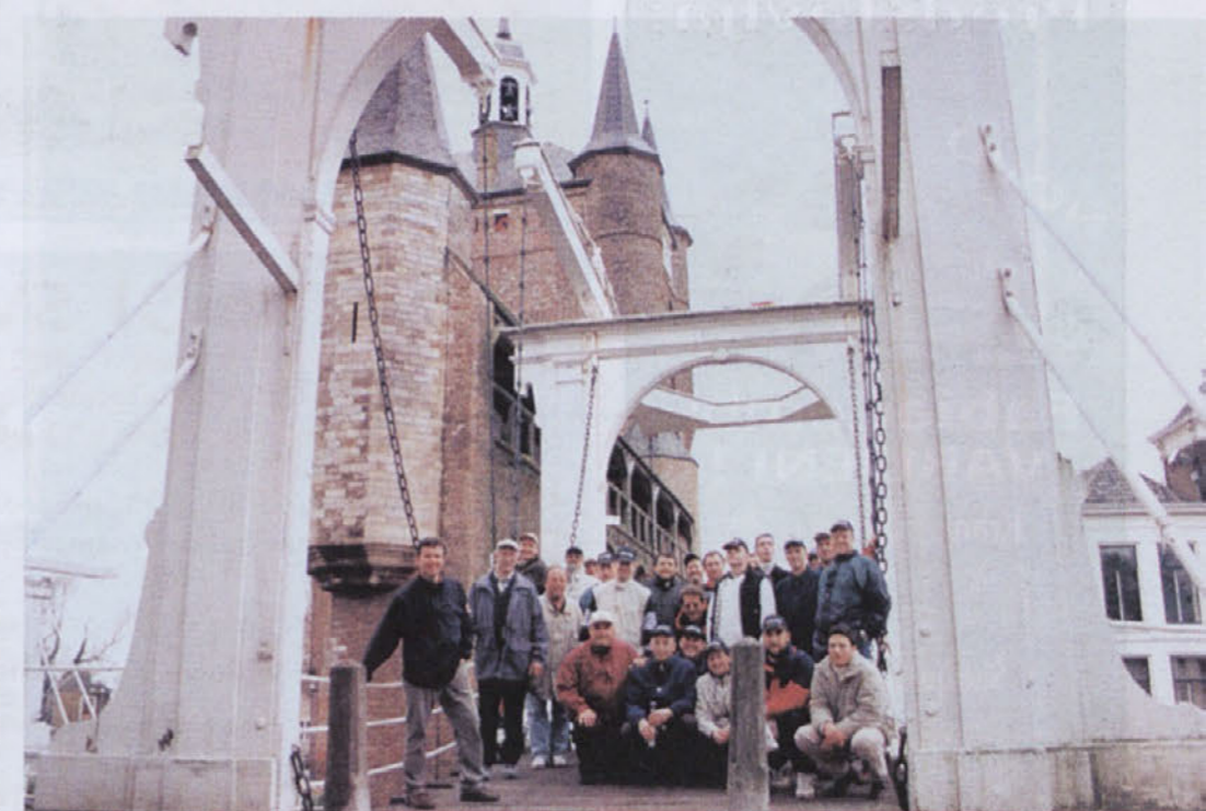
Dvižni most v Liericksee-ju