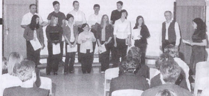
Pevski zbor veroučne skupine Pirniče