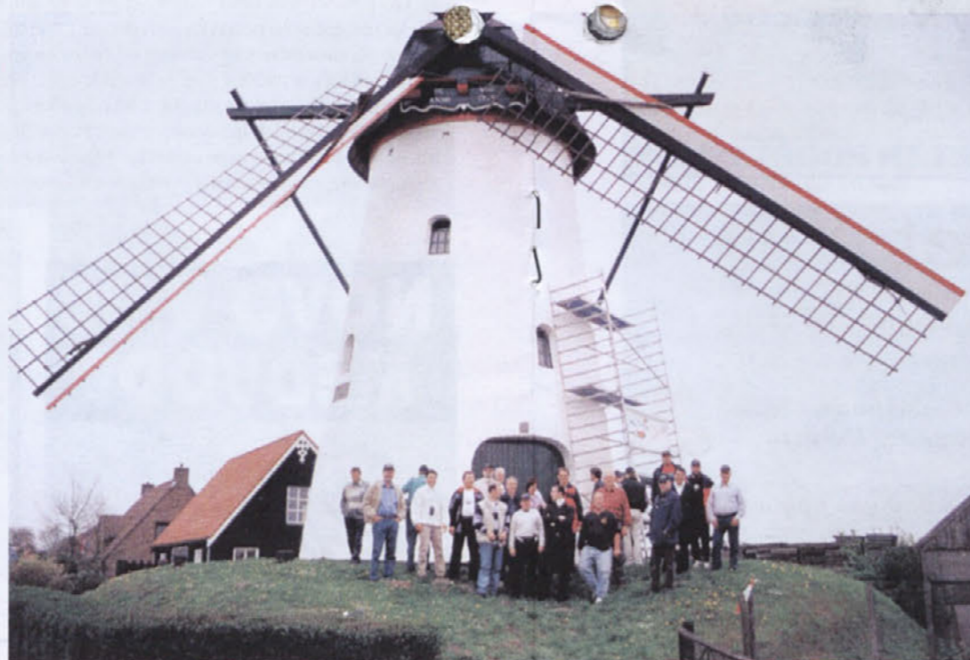
Ob gozdnem robu mlin stoji, tra la, la, la, la, la in mlinarca...