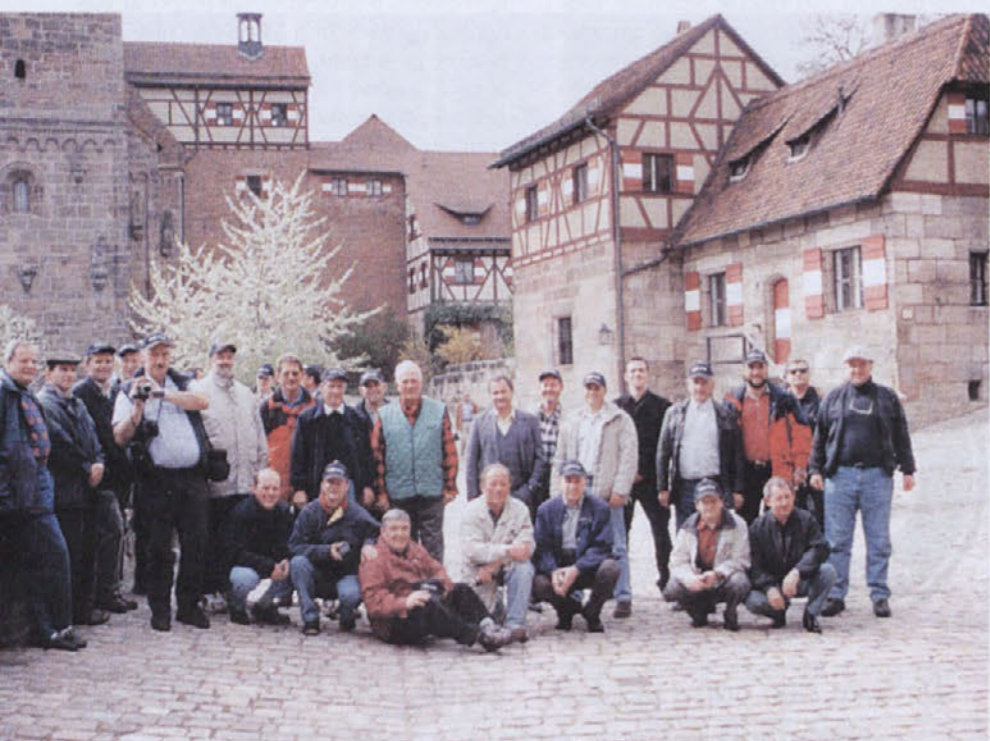
Na nürnberškem gradu

Za LPZ Medvode, Bojan Orel Nadaljevanje v naslednji številki