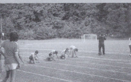
Mlajši dečki tik pred startom teka na 60 metrov.

V petek, 18. maja, je bilo na atletskem stadionu v Tacnu občinsko prvenstvo v atletiki. Učenci medvoških osnovnih šol in OŠ Vodice so se pomerili za veliki in mali atletski pokal. Starejši dečki in deklice (učenci sedmih in osmih razredov) so tekmovali v teku na 60, 300 in 1000 metrov, v štafeti 4-krat 100 metrov, v skoku v daljino in višino, v metu