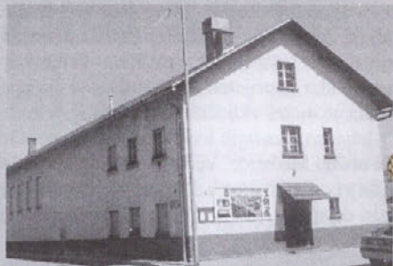
Vodstvo KS Pirniče je kulturnikom med drugim očitalo, da hoče velik kulturni dom vse "od ceste do fižola". KUD Pirniče nasprotno meni, da vodstvo krajevne skupnosti želi izriniti kulturo iz zgradbe in načrtuje "potrošniški dom".

Srž problema se že sicer kaže v dveh različnih izrazih, ki jih eni in drugi uporabljajo za isti dom. Krajevna skupnost govori o domu krajanov, KUD Pirniče pa o kulturnem domu. Prva je lastnica, ki že nekaj let v vzdrževanje doma ni dala veliko ali nič, drugi najemnik, ki so mu, ob poravnavi dela stroškov, dani prostori v brezplačni najem. Dom naj bi bil namenjen vsem krajanom - kaj torej menijo oni?