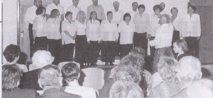
Mešani pevski zbor KD Jakoba Aljaža