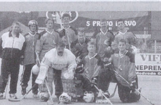
Domačini in-line hokejisti

Celotno prireditev sta organizirala KD Godba na pihala Medvode ter Odbor za prireditve pri županu domače občine, ki sta bila tudi gostitelja omenjene prireditve, ki bo v prihodnje vsako leto v drugi polovici maja pod naslovom: "POZDRAV POLETJU".