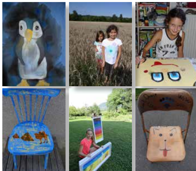
Metka Gosar, slikarka in mentorica