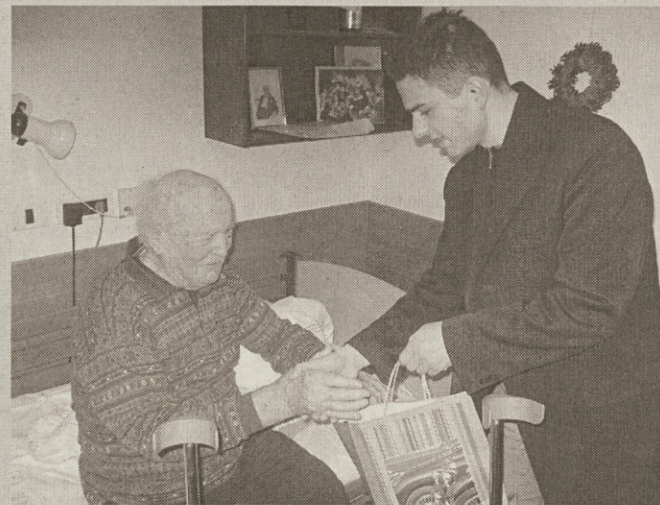
Občinski svetnik Matej Tonin čestita slavljenca za visoki življenjski jubilej.