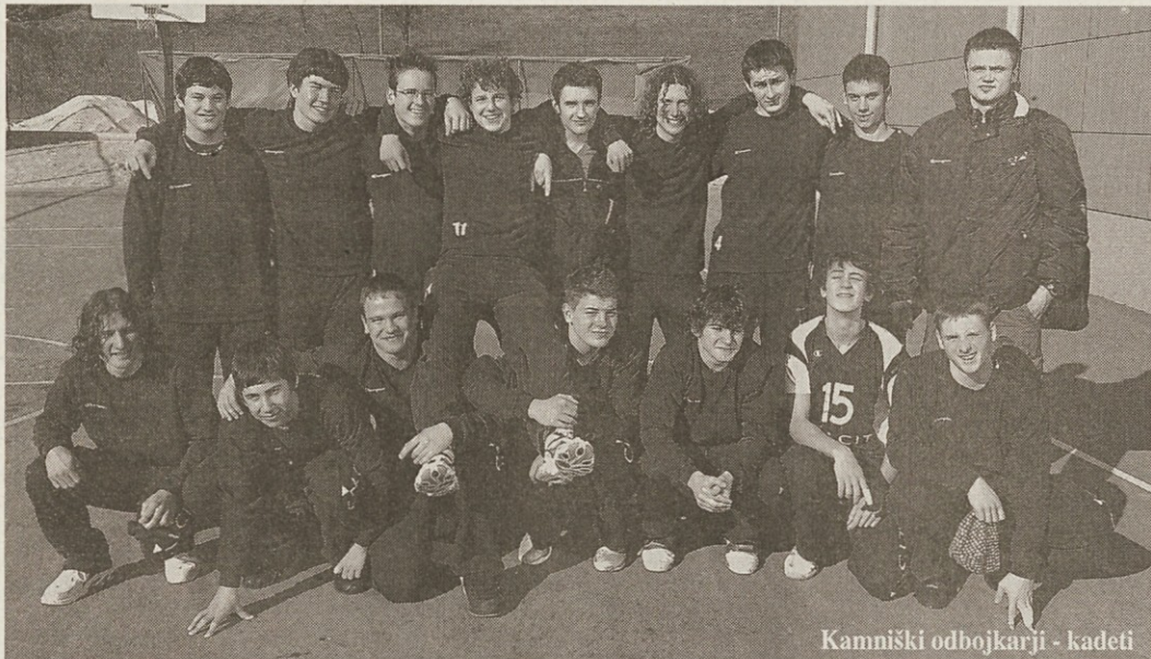
Kamniški odbojkarji - kadeti