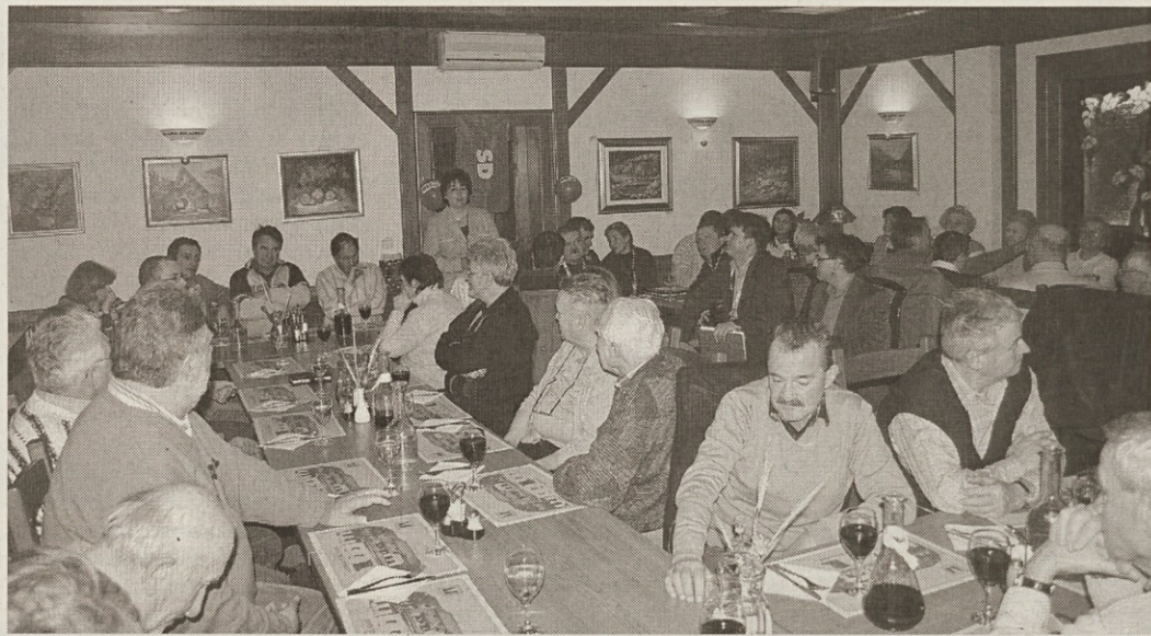
Srečanje socialnih demokratov OO SD Kamnik Komenda