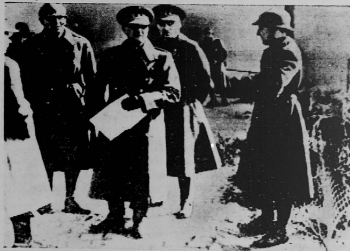
Častniki belgijskega generalnega štaba pregledujejo utrube ob nemški meji, od koder bi mogel priti nemški vdarec. Belgijci so v zadnjih letih jako oborožili obmejne postojanke.