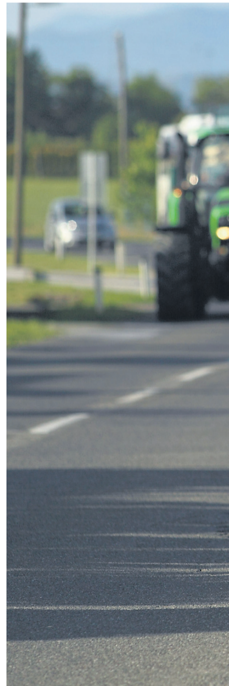
Pot do in od avtobusnega postajališča v