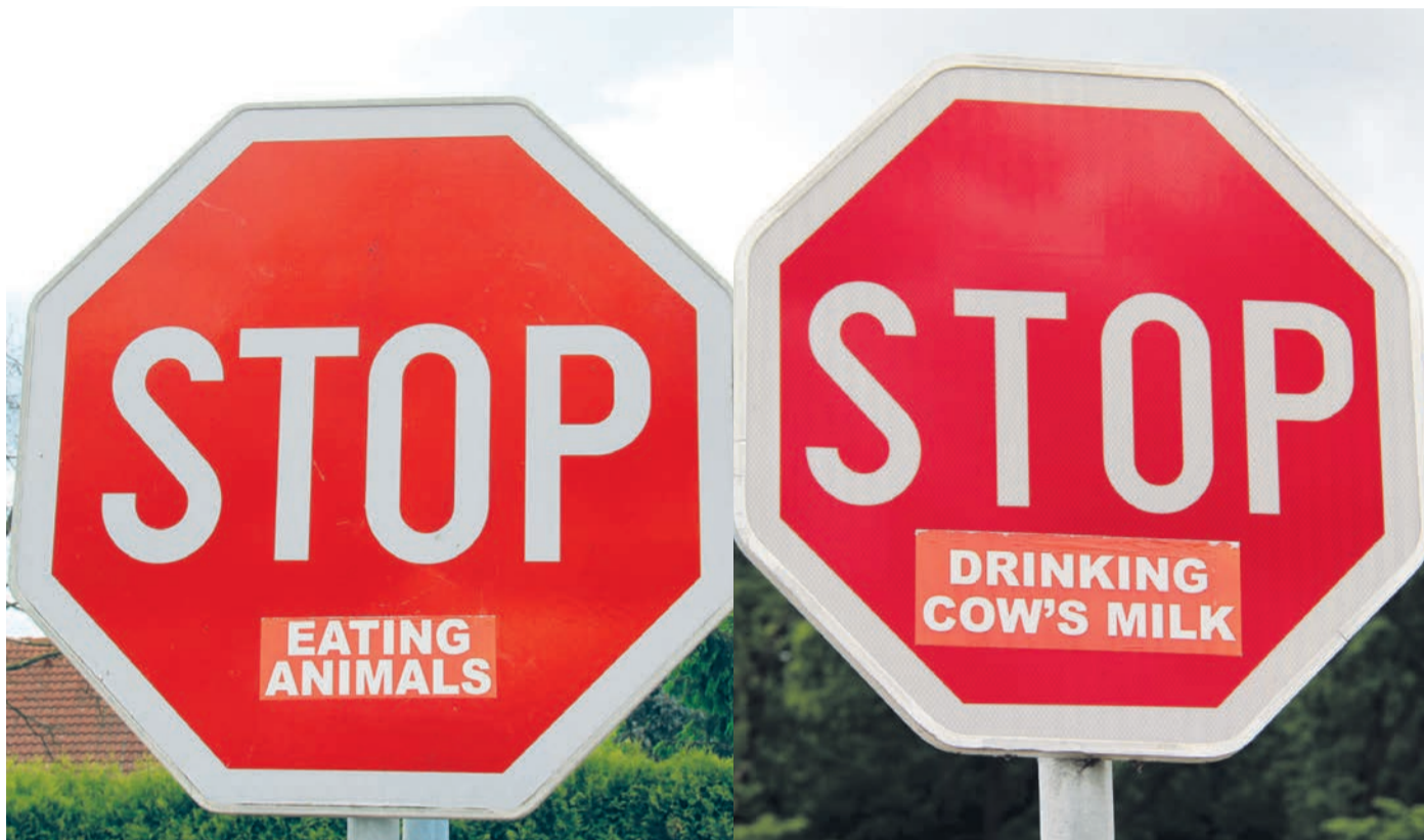
Prometnega znaka ni dovoljeno spreminjati. Kazen za tovrstno dejanje (nalepka na znaku) je za fizično osebo tisoč, za pravno 4.000 evrov. Enaka kazen velja tudi za druge primere poškodovanja prometne signalizacije, kot so kraja, zlom, zvin, napis na znaku, preluknjanje ...

Na priključku lokalne ceste iz Mezgovcev na regionalno v bližini naselij Borovci, Prvenci in Strelci, so aktivisti za pravice živali za izražanje svojih stališč zlorabili prometne znake.