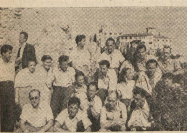
Pred nedavnim so bili tržaški demokratični novinarji na obisku pri svojih stanovskih tovariših v Sloveniji. Pri tem so povabili gostitelje, da jim vrnemo obisk v Trstu. Te dni je res prišla v Trst večja skupina slovenskih novinarjev iz Ljubljane in Maribora.