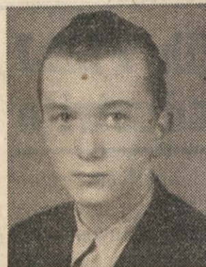
Tov. Franc je rojen 5.1.1927. Ob razpadu fašistične Italije je bil v Trstu. Stopil je v partizane in sicer v Gortanovo brigado. Meseca oktobra istega leta je padel na položaju v Klani-Istra.