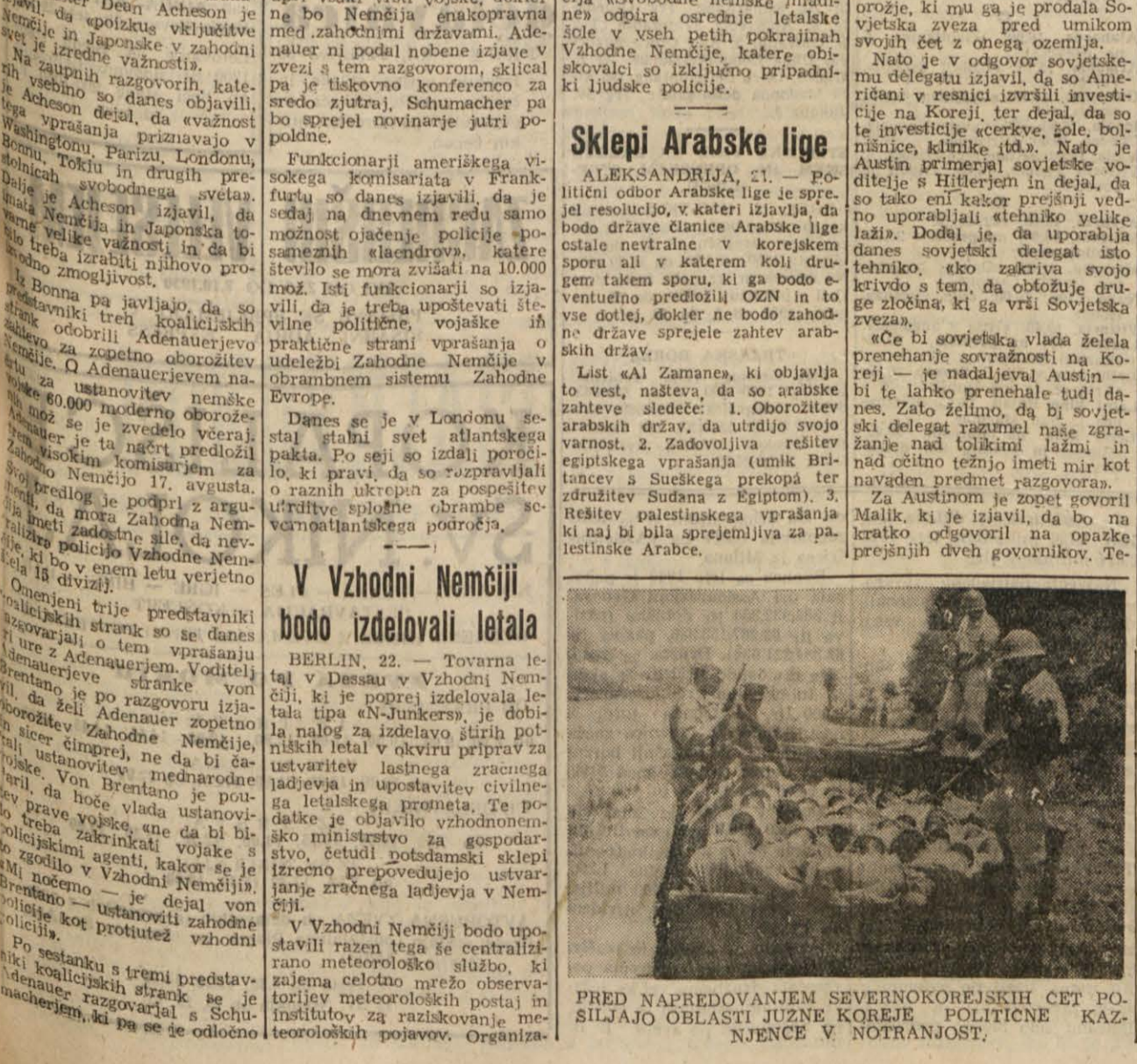
PRED NAPREDOVANJEM SEVERNOKOREJSKIH ČET PO SILJAZO OBRASTAJ JUŽNE KOREJE POLITIČNE KAZNJENCE V NOTRANJOST.