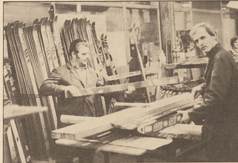
Vestni delavci pri izdelavi smučiči

strija kot smučarska velesila prodrla na svetu in bo kot takšna vedno imela dobre tekmovalce in bomo morali priti v avstrijski ski-pool. Sedanje ovire na avstrijski strani pa so takšne, da v pool ne moremo, pa tudi naše notranje razmere nam širše ekspanzije malce onemogočajo, ker je avstrijski ski-pool zelo drag. Je pa samo vprašanje časa, kdaj bomo prišli vanj. Smo pa že v koroškem ski-poolu in mislim, da je to napredek.“