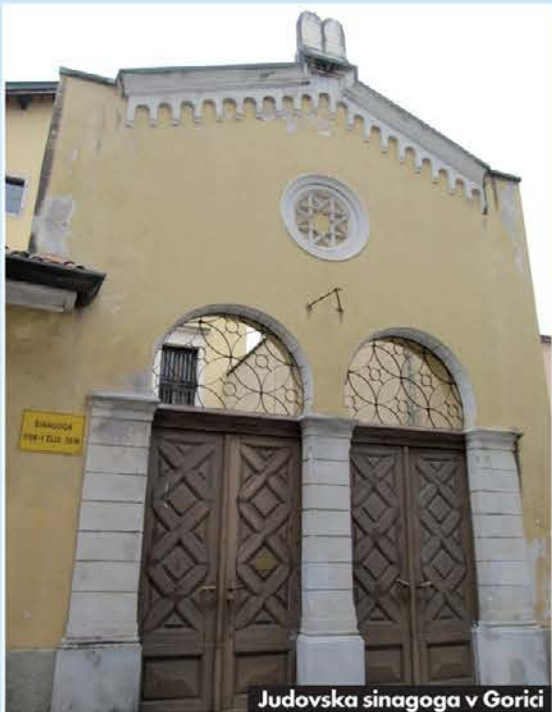
Judovska sinagoga v Gorici