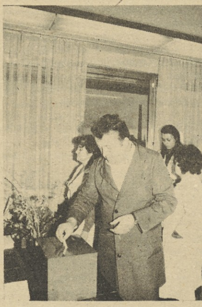
Z volišča v TOZD Napajanja.