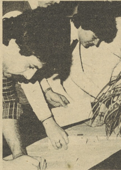
Z volišča v Telematiki.

Za nami so letošnje volitve v samoupravne organe in splošne volitve delegacij v skupščine družbenopolitičnih skupnosti in samoupravnih interesnih skupnosti. Verjamemo, da nam je uspelo, in da smo za delegatske