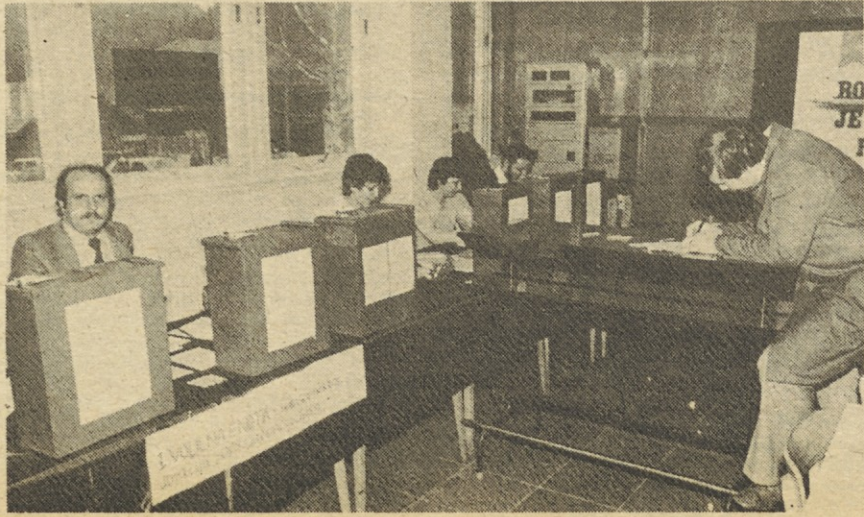
Na volišču v Polprevodnikih.

Hkrati z volitvami v samoupravne organe in delegacije SIS je potekal tudi referendum o spremembah samoupravnih splošnih aktov v IEZE. Referendum je uspel v celoti v vseh TOZD. Glasovali so za prilagoditev nekaterim predpisom Zakona o združenem delu in najnovejšim spremembam primernim za boljše delo. KF