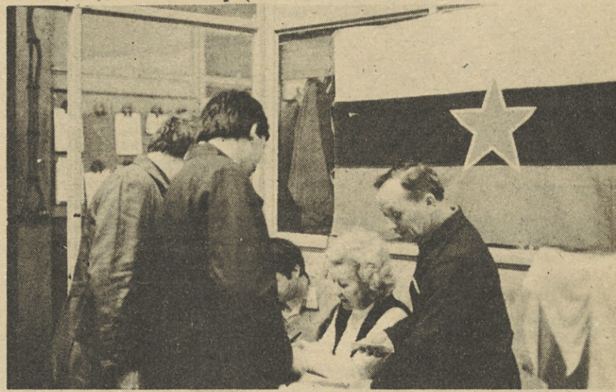
Še kratko navodilo volilcem.