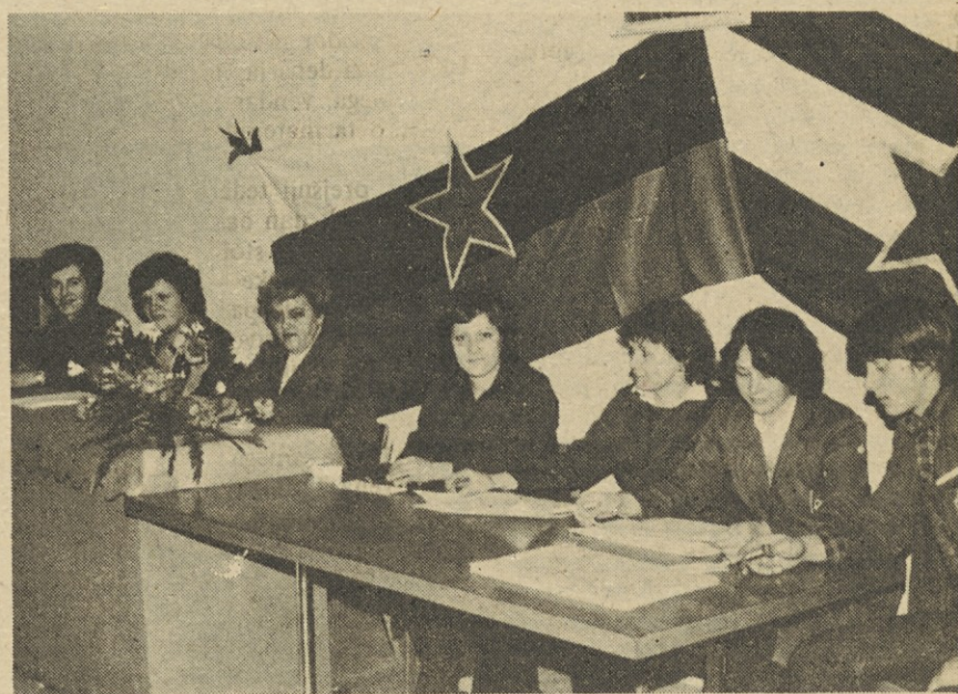
Z volišča v TOZD Generatorji.