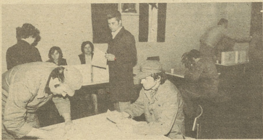
Z volitev v TOZD Magneti.