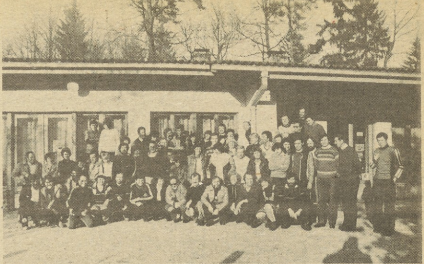
Mo je skupinski posnetek smučarjev SOZD Elkom in SOZD Iskra, ki so se v nedeljo 14. marca v veleslalomu pomerili na Arehu na Pohorju. Posnetek je nastal pred gostiščem v Limbušu, kjer je bila razglasitev rezultatov. Zapis o srečanju je na zadnji strani.