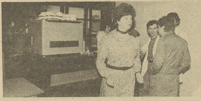
V jedilnici trboveljske Iskre so dobili pravcati, »zaresni« šank. V njem točijo brezalkoholne pijače vseh vrst, čaj in kavo. V kratkem pa bodo tam prodajali tudi sladko in slano pecivo. »Ja, kar bolj možato se poklepeta ob šanku med malico, kot pa nekje za oglom,« nam je dejal delavec. Tovarišica natakarcica pa pravi, da je kar dovolj dela in tudi prometa; prej vsega niso zmogli v kuhinji.