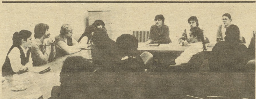
Mladi praktikanti v Telematiki.

Glede na doseganje rezultate delavcev Iskre smo prepričani, da bo tudi v nadalje ZK v tej DO tista idejna sila, ki bo znala in zmogla angažirati vse delavce za še boljše rezultate.