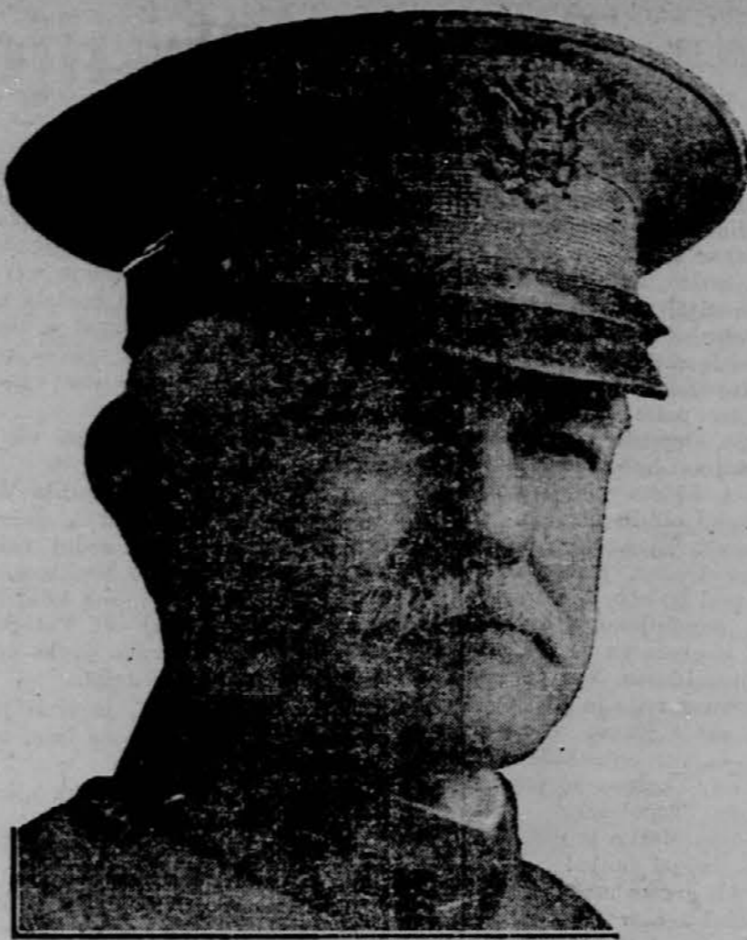
GENERAL W. C. GORGAS.

Le majhen del centralne Amerike je obljuden. Vsaka teh šestih centralno-ameriških dežel bi lahko vzdrževala veliko nadaljnjih milijonov. Costarica, ona naj