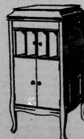
Columbia Grafonola Price $85