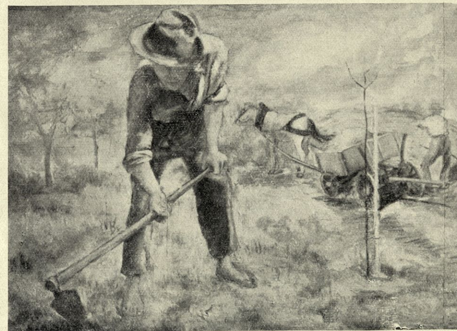
K O P A Č