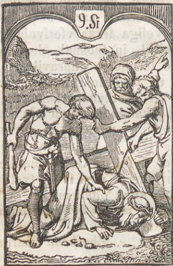
Jesuf tretjizh pod krishem pade.