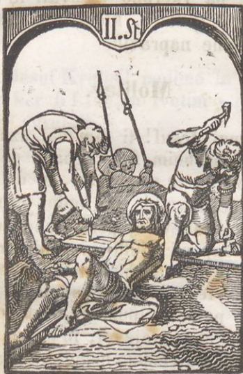
Jesusa na krish perbijejo.