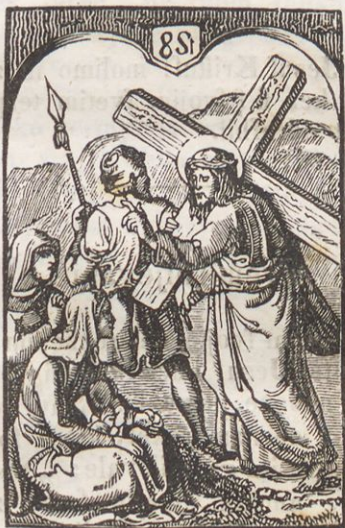
Jesuf troshta Jerusalemske shene.