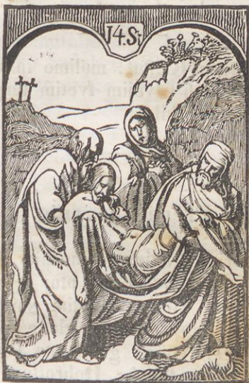
Jesufovo truplo v grob poloshijo.