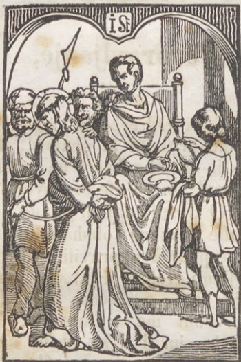
Jesuf k smerti obsojen.