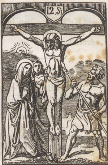
Jesuf umerje na krishi.