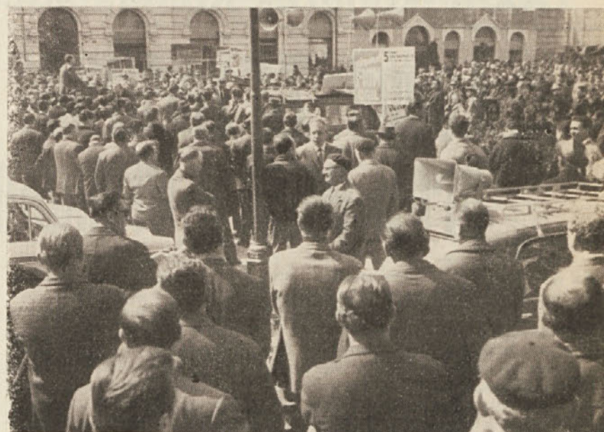
V torek je bila stavka kovinarjev. V Trstu je stavka popolnoma uspešna. Na Trgu sv. Antona je bilo zborovanje. Stavkajoči delavci so prišli na trg v povorkah z dveh strani. S Trga Garibaldi je šla povorka po mestnem središču. V tej povorki so bili delavci ladjeedince Sv. Marka, železarne Italsider in manjših podjetij na obrežju Sv. Andreja. Prišli so čez Trg Unità na Korzo. Stavka spada v okvir borbe za novo delovno pogodbo, kateri pa delodajavci nasprotujejo.