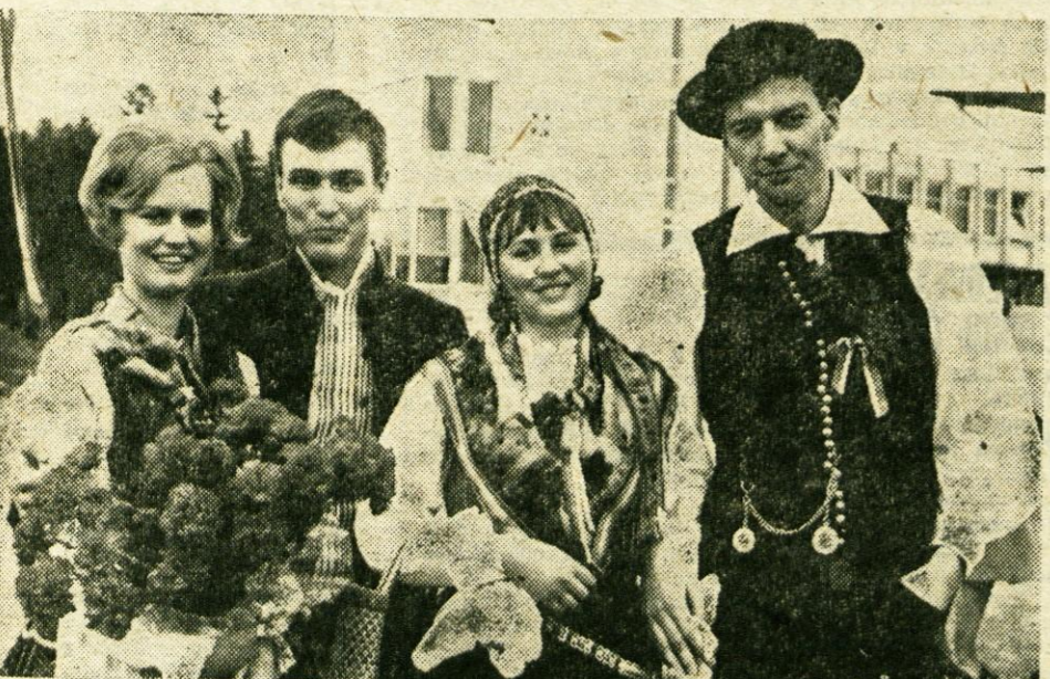
Srečanje našega in švedskega para je že na brniškem letališču napravilo pravo »sobotarsko« razpoloženje

sta ostala v naši državi 10 dni. Spremlja ju 26 švedskih novinarjev.