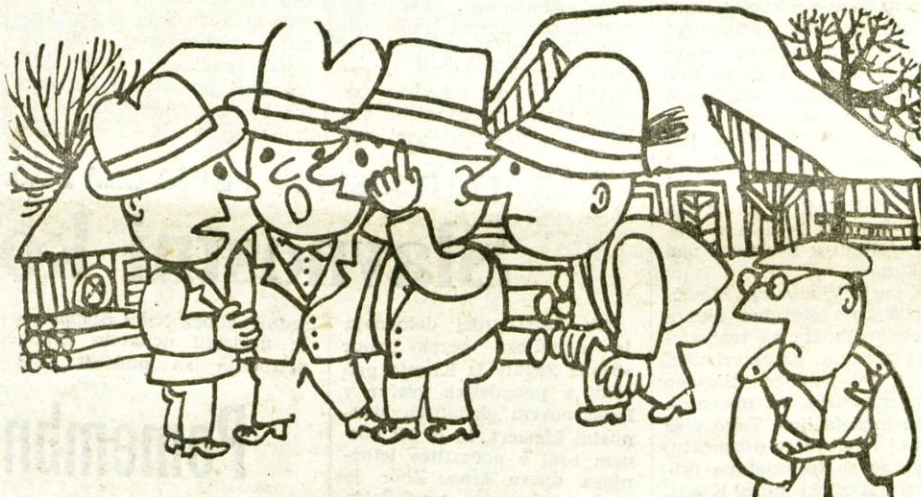
Le kaj se kmetje toliko razburjajo za te gozdove. Poglavitno je, da bomo še naprej lahko gobe nabirali.

Z novo pariteto dolarja je lani postala močno akumulativna tudi njihova kožarna. Medtem, ko so prejšnja leta doma pridelali samo okrog 20 odstotkov vse potrebne dlake, je bodo letos že 60 odstotkov. Zato že nekaj časa povečujejo število zaposlenih. Vse to pa jim bo omogočilo, da bodo letos poleti prešli kot drugo škofjeloško podjetje na 42-urni delovni teden s tremi prostimi sobotami.