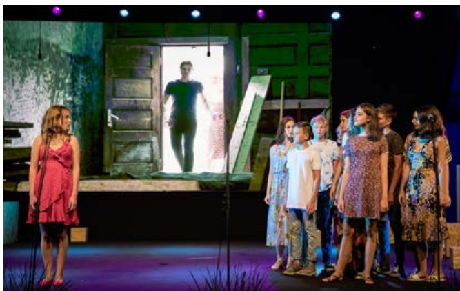
Gledališčniki DPD Svoboda v kulturnem programu osrednje prireditve