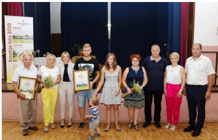
Naziv kmetija leta 2019 je prejela kmetija Bolcar iz Spuhlje; posebno nagrado za ohranjanje tradicije življenja na vasi in ohranjanje arhitekturne dediščine pa je prejela kmetija Simonič iz Krčevine pri Ptuj.