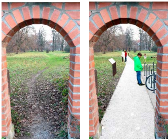
Projekt HICAPS – priprava vsebin za oživetev parka gradu Turnišče. Ena izmed vsebin je tudi investicija v ureditev poti, urbane opreme in zasaditev dreves v parku Turnišče. Levo: trenutno stanje in desno: predvideno stanje – načrt izgleda po planirani ureditvi parka.