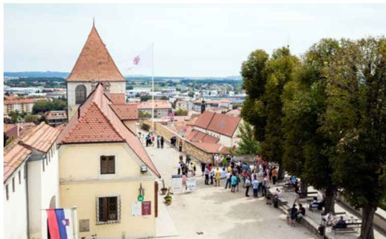
Montaža zastave je bila zaradi teže droga možna samo z avtodvigalom; drog za zastavo je debelostenski in kar 3,5- do 4-krat težji od serijske izdelave, saj je izpostavljen večji sili vetra.