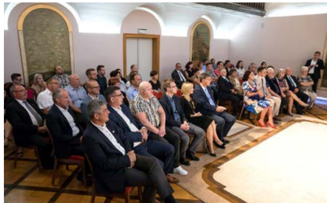
Slavnostna seja Mestnega sveta Mestne občine Ptuj