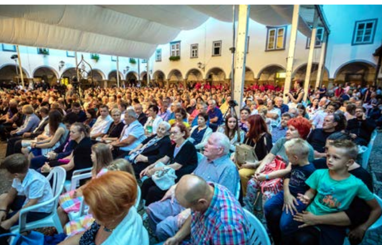
Dvorišče minoritskega samostana je bilo polno do zadnjega kotička.