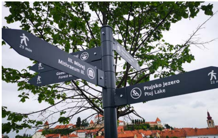
Ptuj je s projektom pridobil strategijo hodljivosti, nove informativne in usmerjevalne table, nove 3D-zemljevide mesta itn.

Mednarodni ali nacionalni razvojni projekti, ki so pomembna točka našega delovanja, so sredstvo za reševanje in odpravo številnih izzivov v regiji. Hkrati so priložnost, da se Ptuj udeležuje različnih dejavnosti po vsej Evropi in prevzame dobre rešitve od drugod.