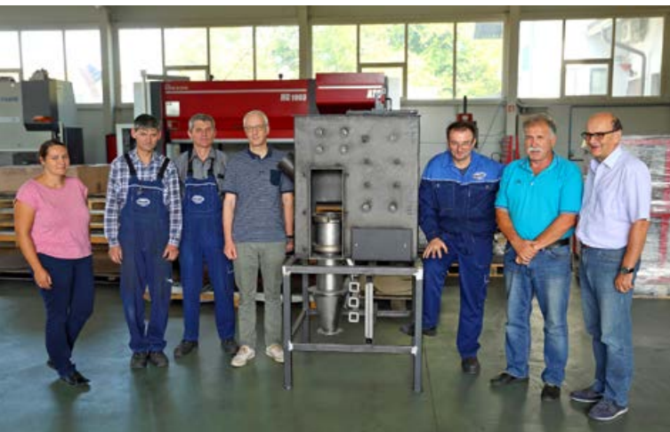
RR-sodelovanje s podjetjem GREGA JK, d. o. o. (razvoj pirolizne peči biomase do trga)