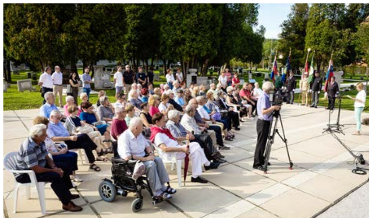
Slovesnost ob dnevu spoštovanja vrednot NOB v Parku spominov