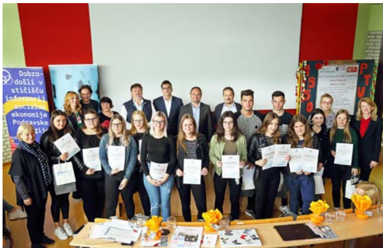
Vsako leto aktiviramo mlade podjetnike v izboru najboljših poslovnih idej – Podjetniški izziv za mlade 2019