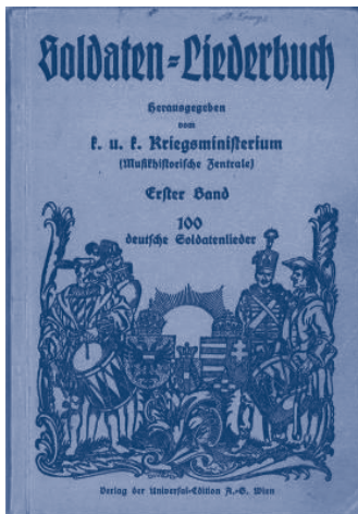
Picture 1: Soldaten-Liederbuch , vol. 1, 100 deutsche Soldatenlieder, ed. by k. u. k. Kriegsministerium (Musikhistorische Zentrale) (Wien: Universal-Edition, 1918).

The article didn't describe those alleged 400 prints of folksongs. The large number of publications must have included very different forms of soldier- and folksongs, because there were just a few publications by the Centre of Music History or representatives of the Folkmusic Movement . A lot of those publications were probably included, and the k. u. k. War Press Department of the Army Command and its musical section under Paumgartner wanted to replace them with material that was suitable in their eyes. What certainly fell within that category were folksongs that had been connected to the character of harmlessness , naivety and innocence since the time of Herder. Not only was the Austrian nation seen as harmless , but even times of war could be played down.