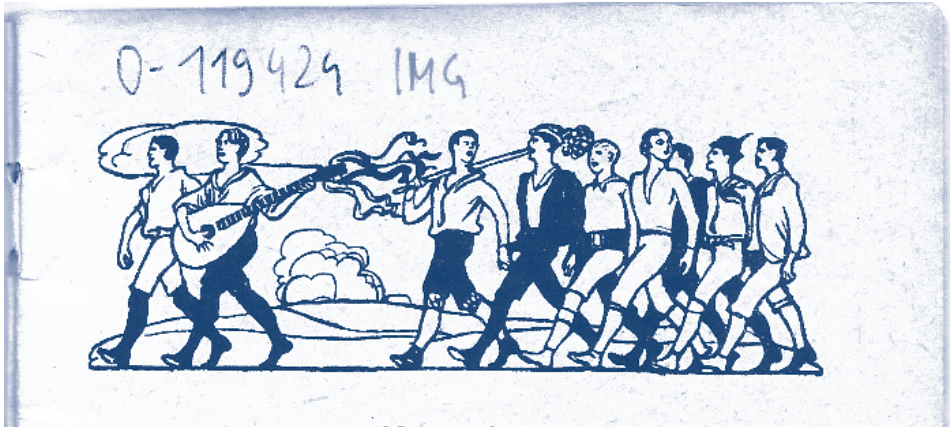
Picture 3: Jung Österreich Lieder , ed. Hans Wagner (Wien: Jung-Österreich Verlag, 1915).