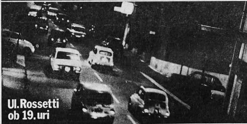
Ul. Rossetti ob 19. uri

Te fotografije so bile posnete v trenutkih največjega prometa na treh živčnih točkah v mestu.