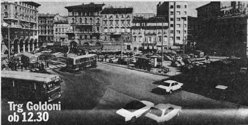
Trg Goldoni ob 12.30