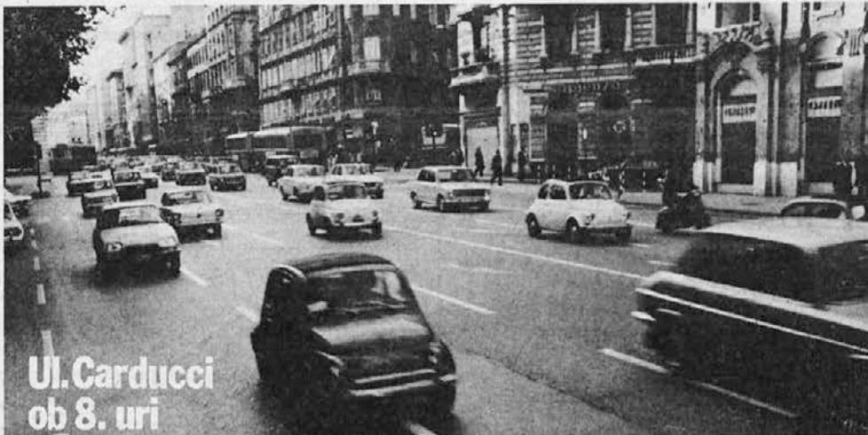
Ul. Carducci ob 8. uri