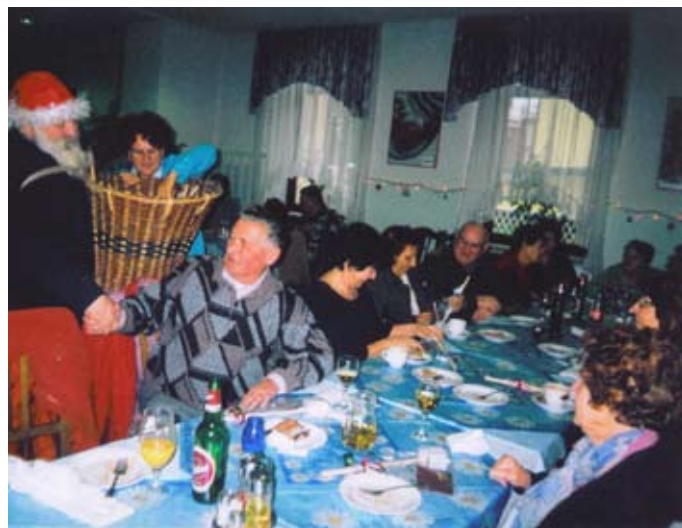
po zapisu Sonje Sever