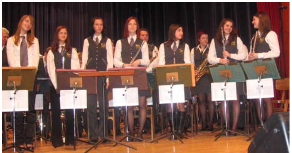
Pihalna godba Moravče