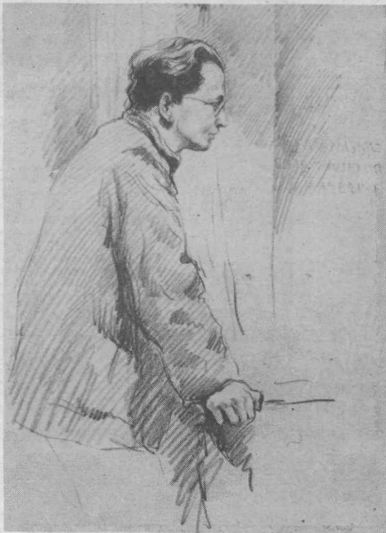
Kardeljev obraz v umetniških podobah – BOŽIDAR JAKAC – E. Kardelj govori na Kočevskem zboru 2.–3. oktobra 1943.