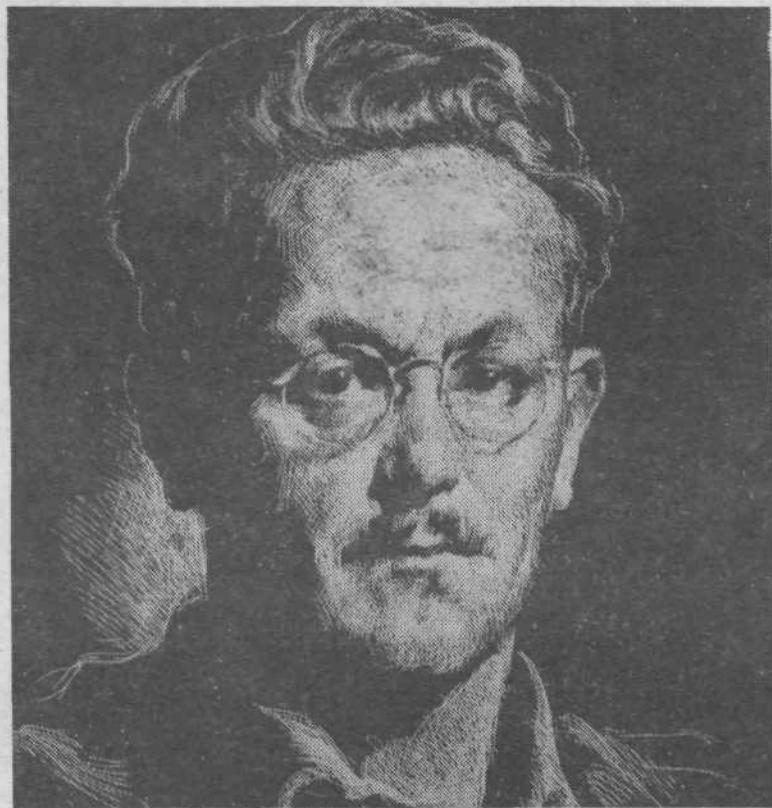
Portret Edvarda Kardelja v globoki jedkanici, nastal v Bazi 20 1944. leta.

»Smeri razvoja političnega sistema socialističnega samoupravljanja«