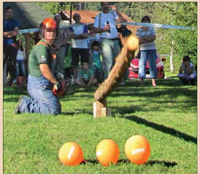
S svojimi veččinami so obiskovalce navdušili mojstri v podiranju drevca z motorno žago.

Godba Zgornje Savinjske doline se je zbranim predstavila z repertoarjem poskočnih melodij. Obiskovalce so zabavali člani ansambla Labod. Ob zaključku uradnega programa je potekala še po-