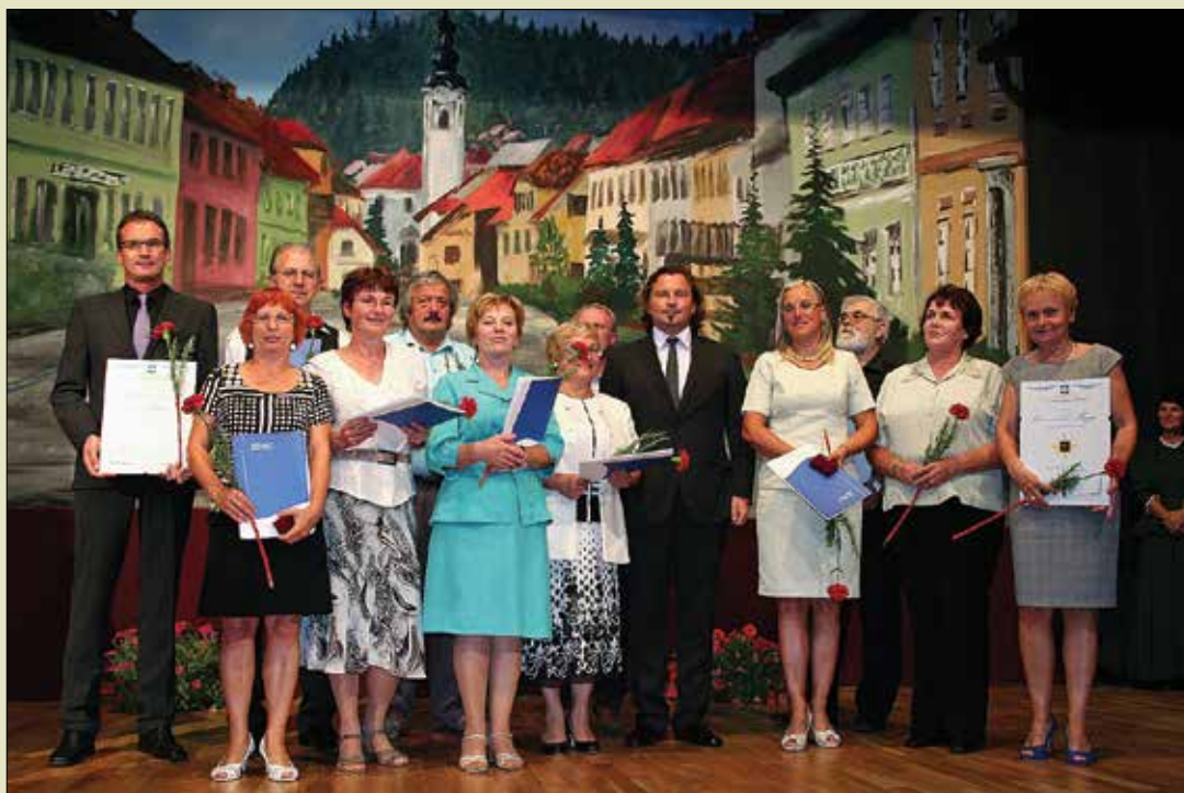
Dobitniki priznanj TZS ob jubileju Turističnega društva Mozirje