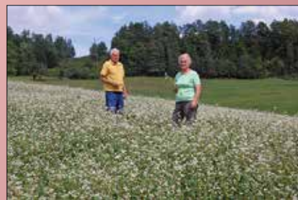
Soseda v vročem avgustovskem opoldnevu na njivi, na kateri dozoreva plod skupnega dela.