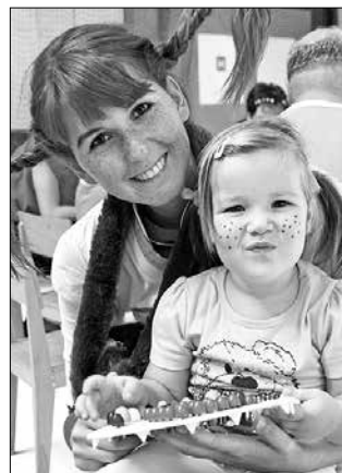
Pika privabi v Velenje preko 100.000 radoživih nagajivcev.

gusarjev. Letošnji sedemdnevni festival bo v znamenju kulture, saj je Pikin festival največji otroški projekt Evropske prestolnice kulture 2012.