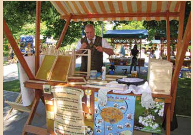
Na Lesarskem prazniku so se predstavili tudi člani Čebelarkega društva Kokarje.