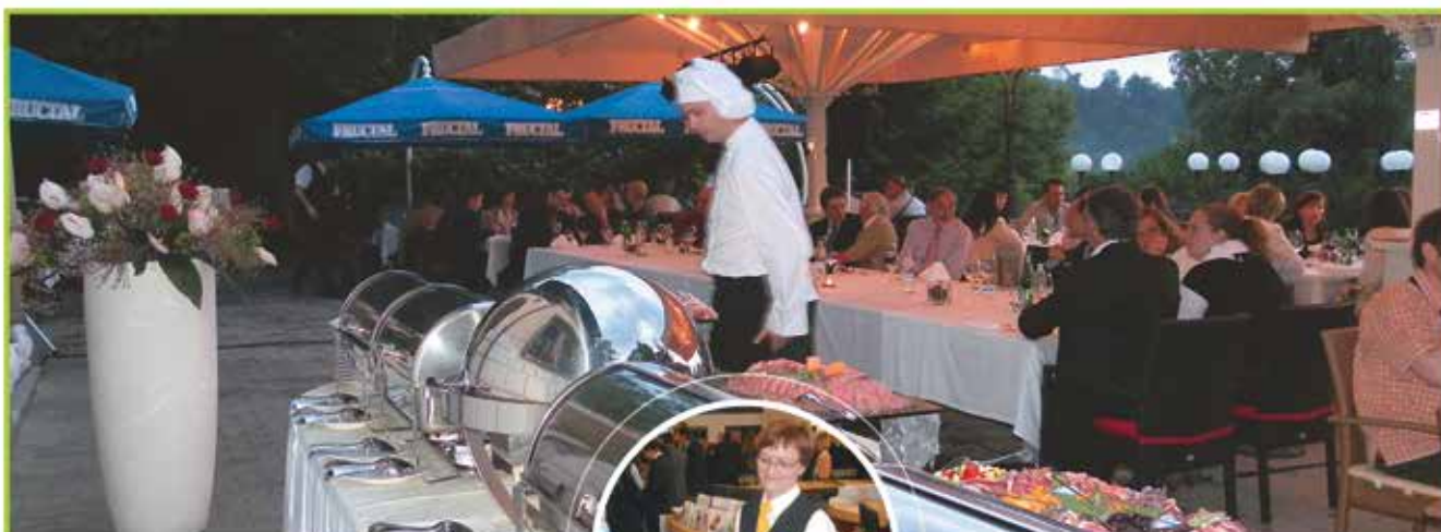
GORENJE GOSTINSTVO, d.o.o.