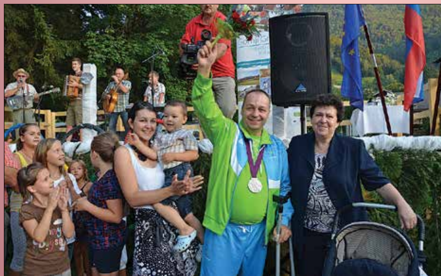
Srebrni paraolimpijec v družbi domačih in domačinov