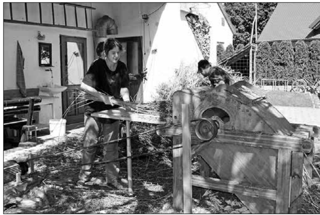
Stara mlatilnica je bila pripomoček za ločevanje stebel od semen.

Konoplja je nezahtevna rastlina: ne potrebuje gojenja in ne za-