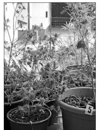
Zasežene sadike konoplje