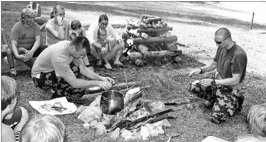
Mladim planincem so vojaki pripravili učni dan iz preživetja v naravi.