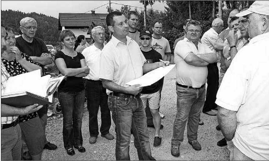
Predstavniki občine in izvajalca so krajanom predstavili projekt novega mostu.