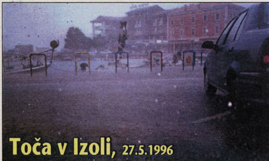
Toča v Izoli, 27.5.1996