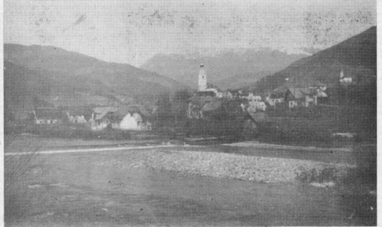
Vlagali smo, vlagamo, naši biseri pa samevajo!

J. KOGOVSÉK: »Smatram, da bi s takim skladom edino reševali to vprašanje, ker smo doslej ta sredstva drobili — pravega efekta pa ni bilo. Tako imamo veliko počitniških domov, ki so preživel svojo vlogo, ker bi se jih morali posluževati vedno isti ljudje. Za rekreacijske centre, ki bi bili širokega tipa, pa nimamo sredstev.