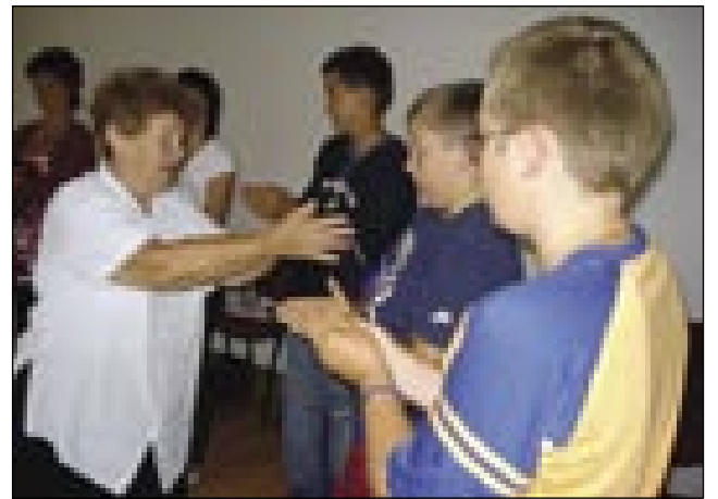
S porabskimi udeleženci na seminarju

»Velikokrat je lahko pesem izhodišče. Recimo pesem »Prvo leto služim...« je lahko primer na brez instrumenta. Ali če sta dva, trije dobri pevci v skupini, lahko igrajo na glavnik in po-