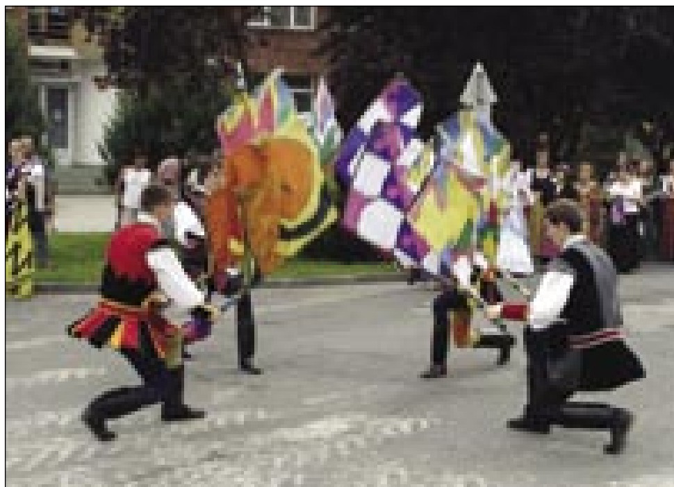
Prizor s povorke

Sobota je bila namenjena športu, in sicer 6. teku v spomin na monoštrsko bitko. Tekška pro-