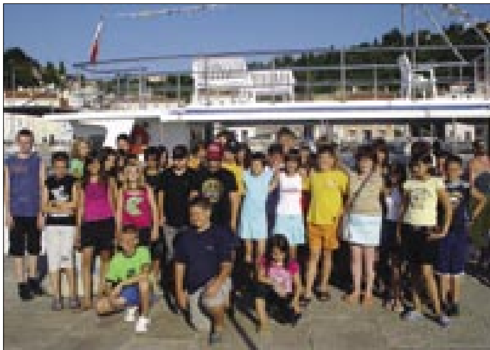
Porabski, štajerski in mačkovski otroci po vožnji z ladjo v Piranu

plaži. Popoldanski čas je bil namenjen učenju jezika in spoznavanju okolja. Zaradi velike skupine (in različnega jezikovnega predznanja – avstrijski učenci so pri sloven-