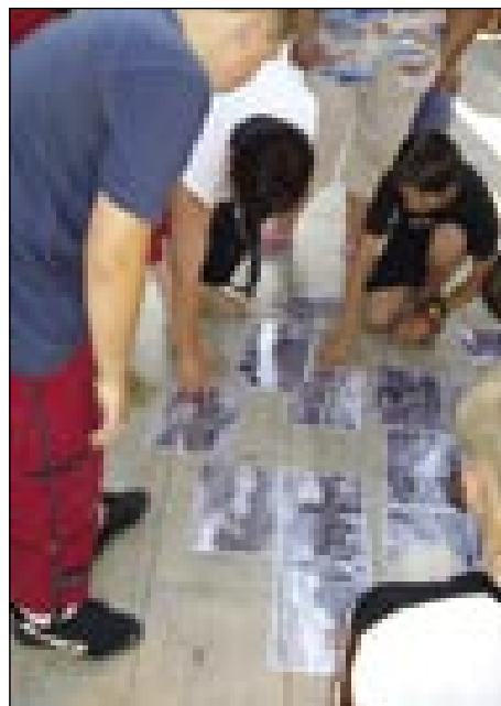
Reševanje naloge ob ogledu Pirana