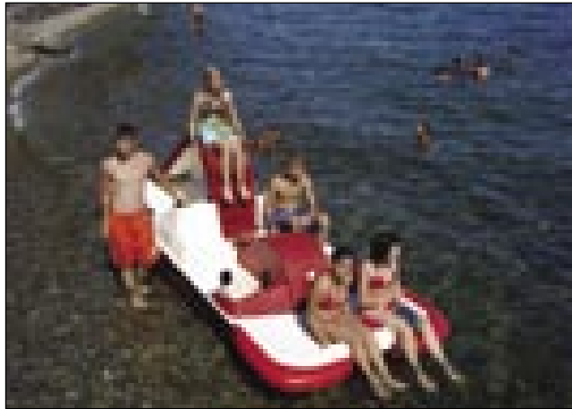
Veselje na morju

Za jezikovne počitnice se zahvaljujemo Zavodu R Slovenije