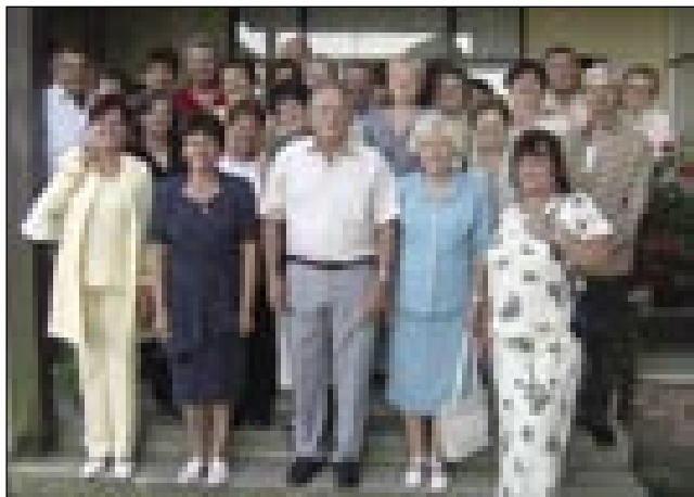
Naš klas pa školnicke pred števanovskim kulturnim daumom

če šče majo kam nazaj pridti. Na 40. letno srečanje nas je iz 28 »mlajšov« prišlo vtjüper 20 pa štirdje školnicke, prcerkorce. Na žalost smo v zadnji dve