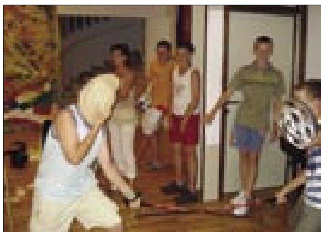
V gledališki delavnici