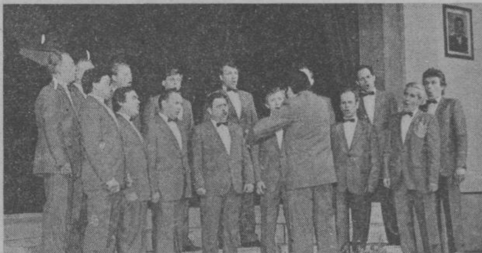
Odbor za vokalno glasbo pri zvezi kulturnih organizacij Ljubljana-Šiška je pripravil dva koncerta odraslih pevskih zborov, ki sta odlično uspela. V Sori in Bukovci se je številnim poslušalcem predstavilo 15 zborov s po štirimi pesmimi.