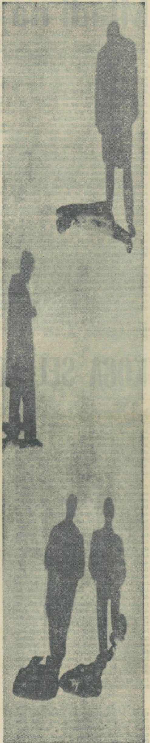
OPOLDANSKE SENCE

Letos je bil odziv na razpis posojil nekoliko manjši kot lani. Po našem mnenju ni vzrok toliko v strožjih jamstvenih pogojih, (ki so v bistvu še vedno zelo ugodne za interese) temveč v izboljšani štipendijski situaciji.