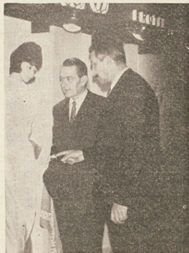
Detajl iz sejma MODE 1971