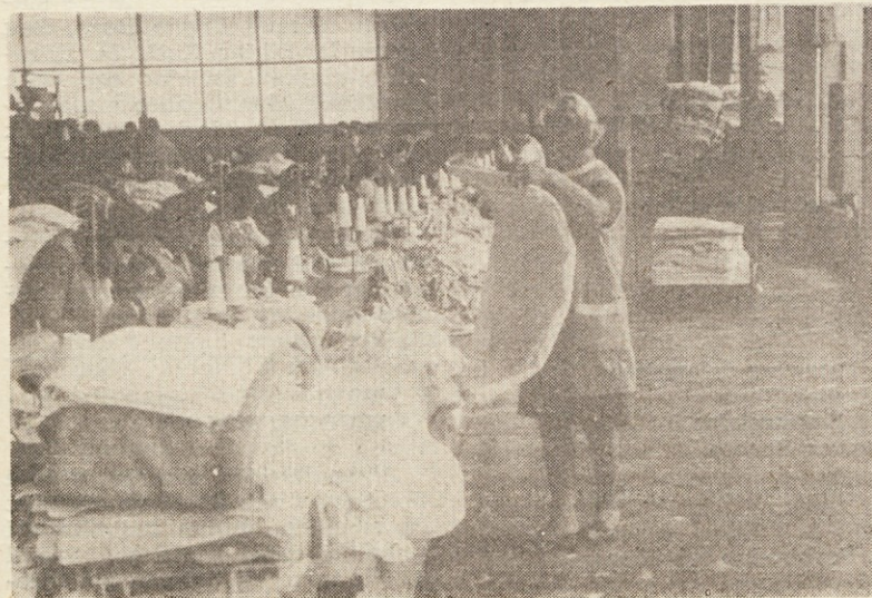
Skozi roke vsake delavke — robilke gre dnevno povprečno 1.400 metrov robljenih brisač.

Letos se je zopet ponovila lanska situacija, da nam naši inozemski kupci niso pravočasno poslali svoje embalaže. Zato se je v šivalnici nabralo blaga čez glavo, istočasno pa je primanjkovalo dela. Kupci so navajeni, da jim embalažo priskrbi proizvajalec in prihaja od takih zamud zato, ker pri nas ni ustrezne embalaže je ne moremo nabaviti. Morda se bo stvar v prihodnje le nekako uredila. Vendar se to ne dogaja samo pri nas. Vsa podjetja, katerim dobavljajo kupci embalažo, imajo slične težave.