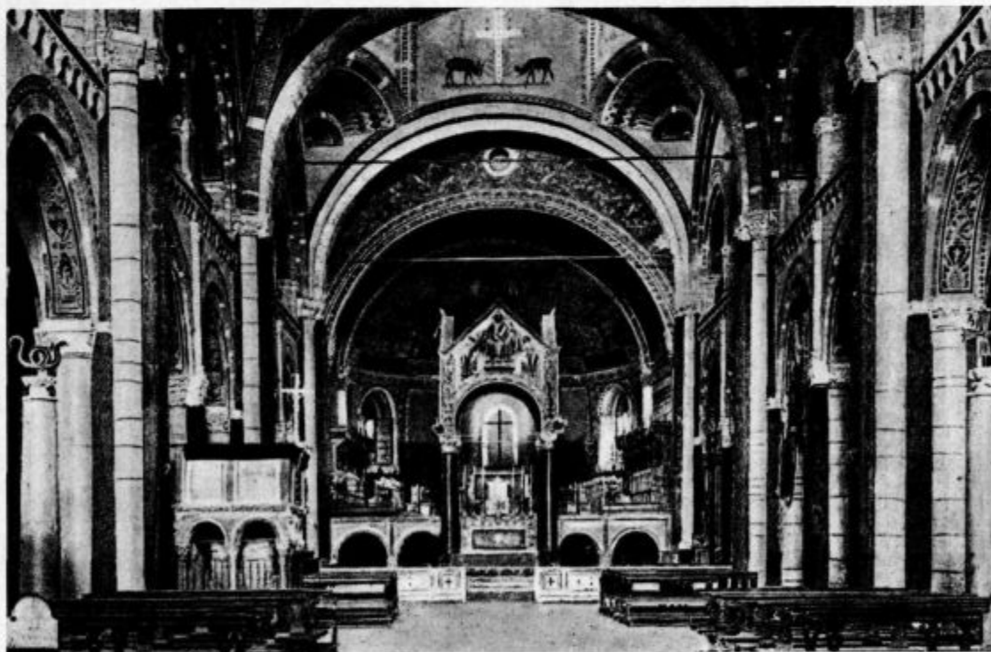
Bazilika sv. Ambrozija v Milanu. Notranjščina (God sv. Ambrozija, patrona čebelarjev, 7. decembra)

Judež je prodal Gospoda za 30 srebrnikov; danes bi ga ceneje, ker jih je več.