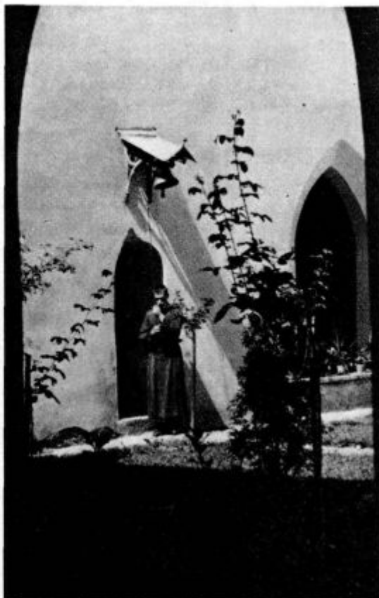
Stična: Poldne zvonil

Upam, da smo se ločili vsi ene misli in vsi z enim sklepom: Če hočemo v pobož-