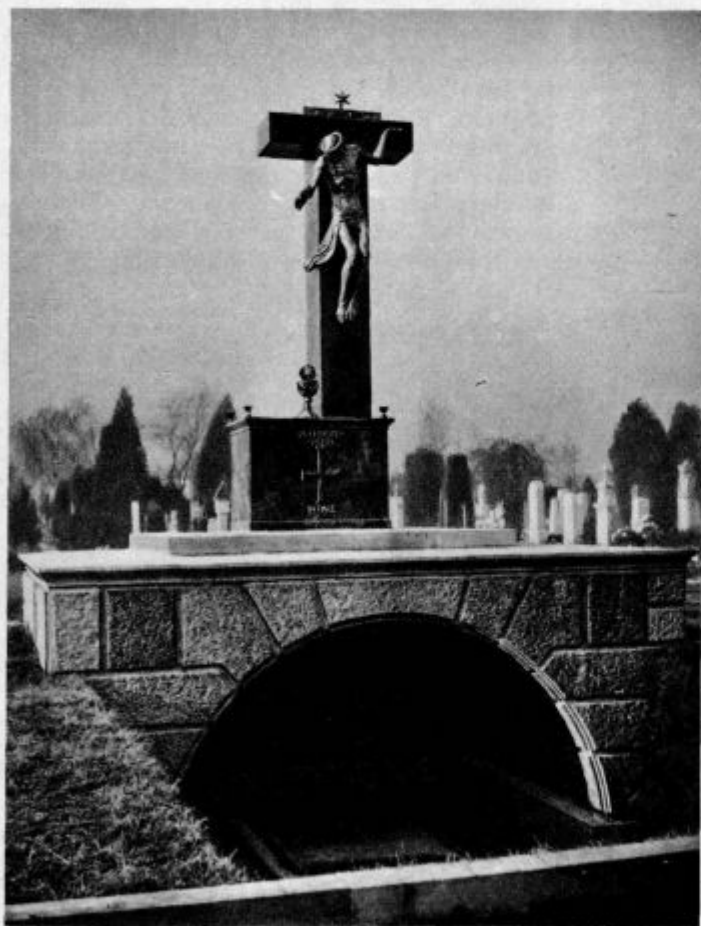
Nagrobni spomenik na ljubljanskem pokopališču Oddelek za duhovnike

»Kako naj bo molitev brez življenja! Saj ni človek!« je hi-