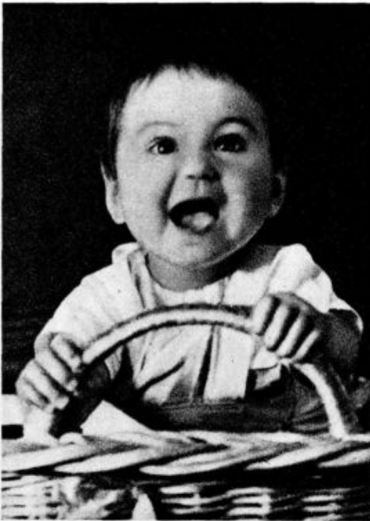
„Se gremo avto?“

lico in gobo in zakaj tako vdano zaupno upira svoje oči v prečisto Mater božjo.