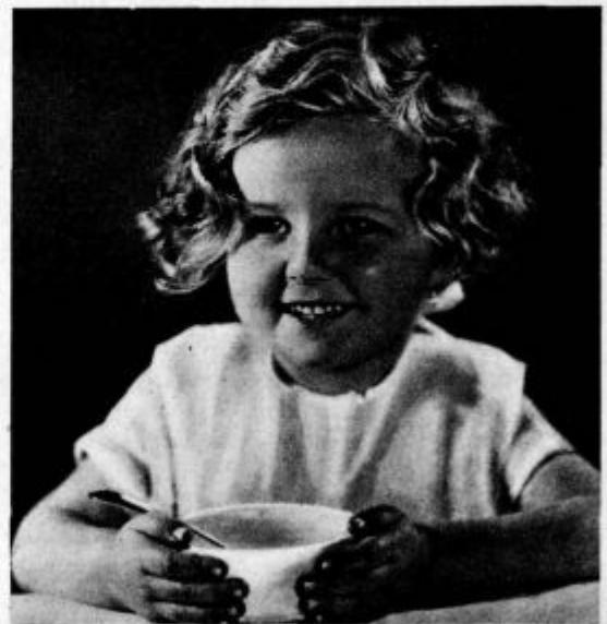
»Mama že ve, kaj meni diši!«

Sedaj sem sv. Bernarda in njegovo sliko še bolj doumel, zdaj mi je postalo jasno, zakaj drži v levici velik spokorniški križ s su-