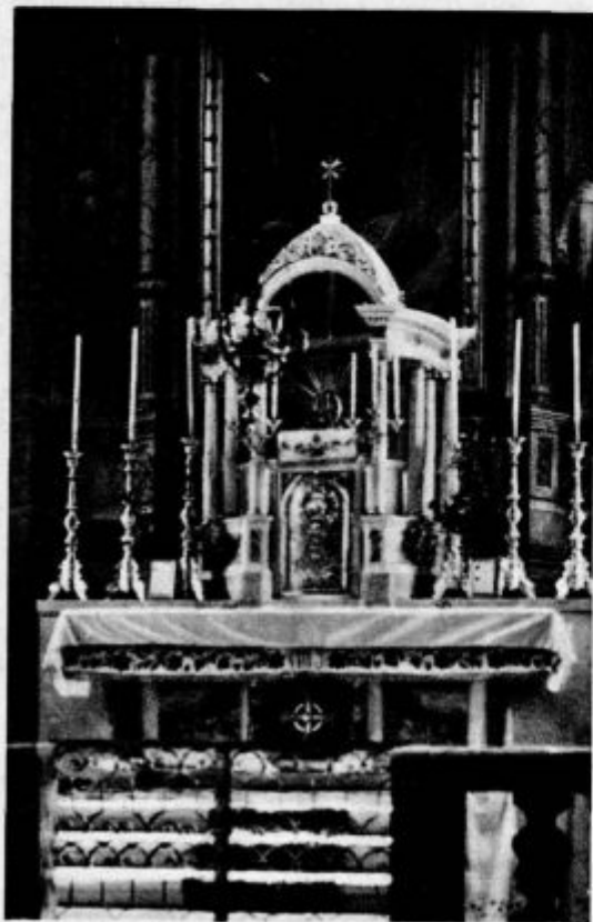
Novi oltar v župnijski cerkvi višnjegorski

Torej: »Bogoljuba« v roke, dokler je še čas! Prosim Vas, drage matere, ne bodite hude, ko vam v tem oziru tako mlad piščanec navste daje.