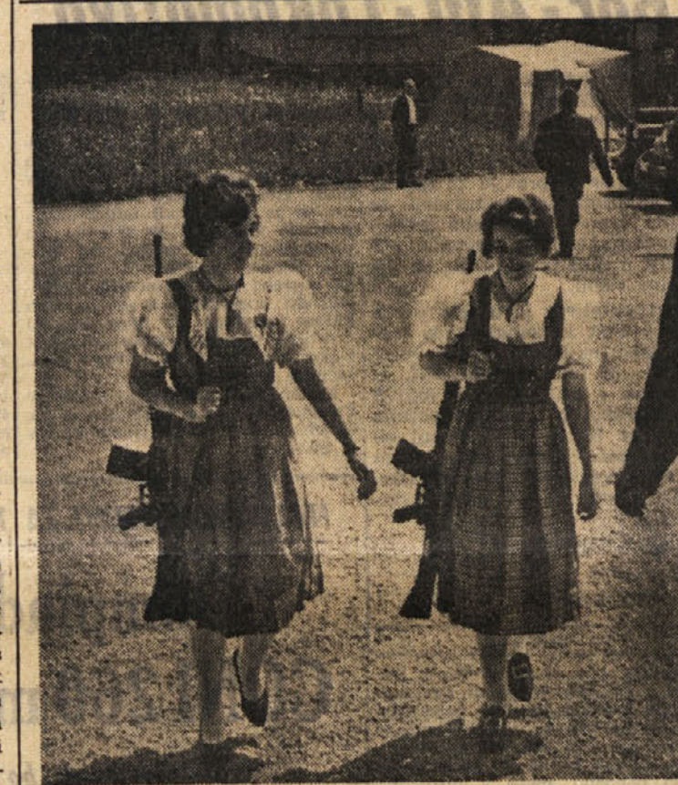
Švicarji so zelo miroljubni ljudje. Kljub temu so vedno pripravljani, svojo deželo braniti. Zato se tudi ženske vadijo v orožju

Prvi glasovi o tem, naj bi Cerkev spremenila svoje stališče, prihajajo iz Francije in Anglije - Jezuit iz izkušnjami iz Indije, kjer je videl ljudi umirati od lakote