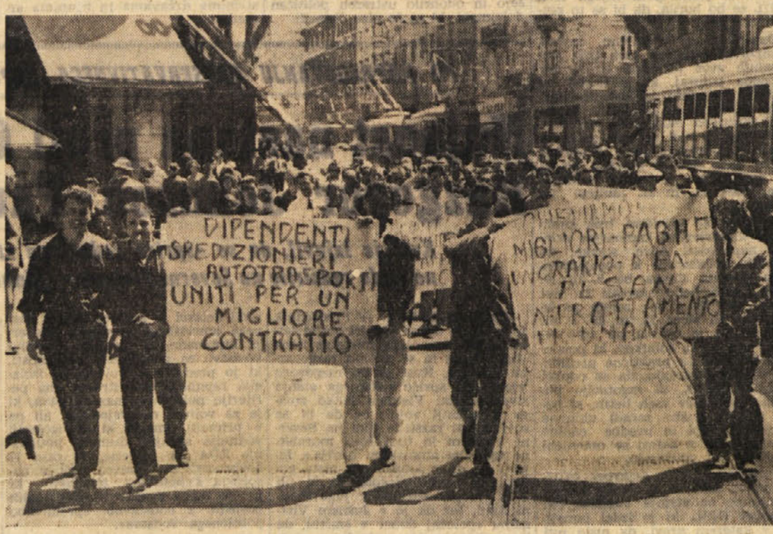
Delavci spediterskih in prevoznih družb demonstrirajo po tržaških ulicah

Stavka in povorka delavcev spediterskih in prevoznih družb skoraj 100-odstotna udeležba v stavki tekstilnih delavcev