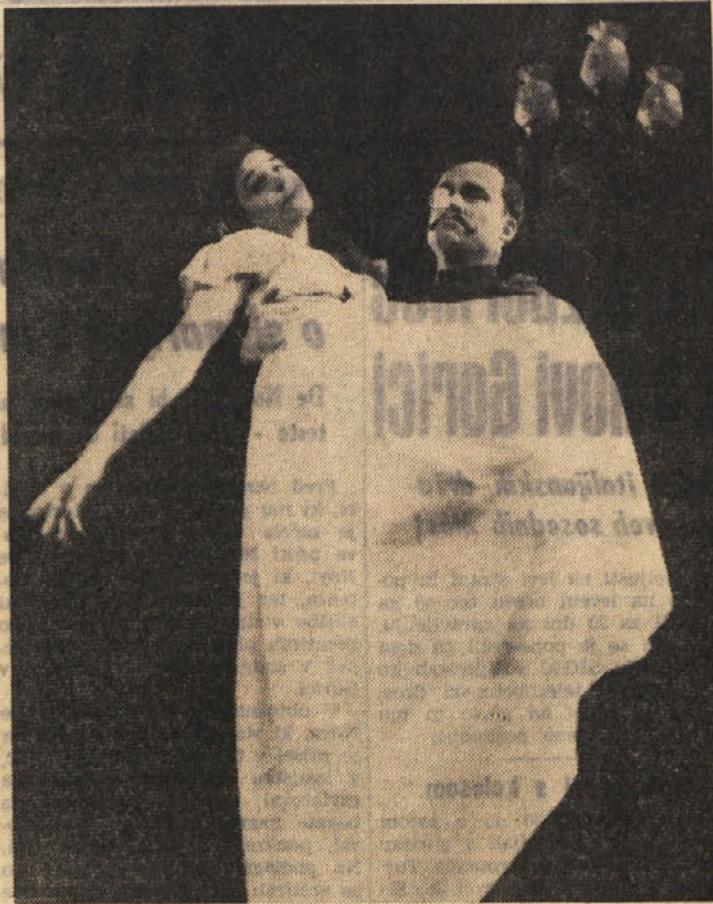
Slika iz komedije «Rezervista», s katero prihaja v Trst na gostovanje Slovensko ljudsko gledališče iz Celja. Celjski gostje bodo uprizorili tri predstave in sicer v soboto, nedeljo in ponedeljek.

tudi kot surovina v tekstilni industriji in drugod. Ko bo izpeljan tudi ta program, pravijo tu, bo čez 10 let razlika med sedanjim in bodočim Azerbejdžanom tolikšna, kot je ona med sedanjim Azerbejdžanom in onim, kakršen je bil kot fevdalna pokrajina v času carske Rusije: iz fevdalnega stanja torej v industrijsko deželo, iz industrijske dežele v... bodoči Azerbejdžan, ki se ne da niti naslutiti. In zasluga za ta skok bo pripadala spet nafti, toda tudi temperamentalnemu in delovnemu ljudstvu Azerbejdžana, s katerim gradi novo življenje še 40 drugih narodnosti, ki so se iz drugih predelov SZ preselila v to zakavkasko republiko. RODOLJUB BOGOJEVIČ