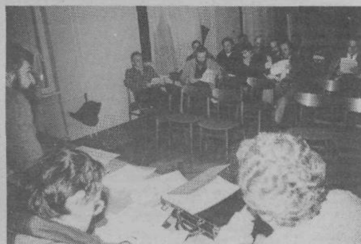
S seje temeljne kandidacijske konference v Polju

analitične podatke o sestavi delegacij v občini. Na občinski kandidacijski konferenci so delegati sklenili