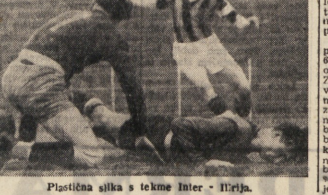
Plastična silka s tekme Inter - Ilirija.