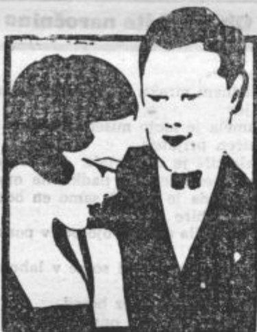
PREPIR V ZAKONU

Služkinja: »Seveda, gospa! Ampak tako lepo je dišalo, da sem ga dala za nekaj časa v omaro med svoje perilo.«