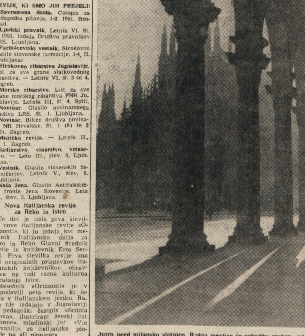
Jutro pred milansko stolnico. Rahla meglica se nekoliko zastira vitke oblike neštetih stolpov.

REVJE, KI SMO JIH PREJELI: Savremena škola. Casopis za pedagoška pitanja, 1-2. 1951. Beograd. Ljudski pravnik. Letnik VI. St. 3. 1951. Izdaja Društvo pravnikov LRS, Ljubljana.