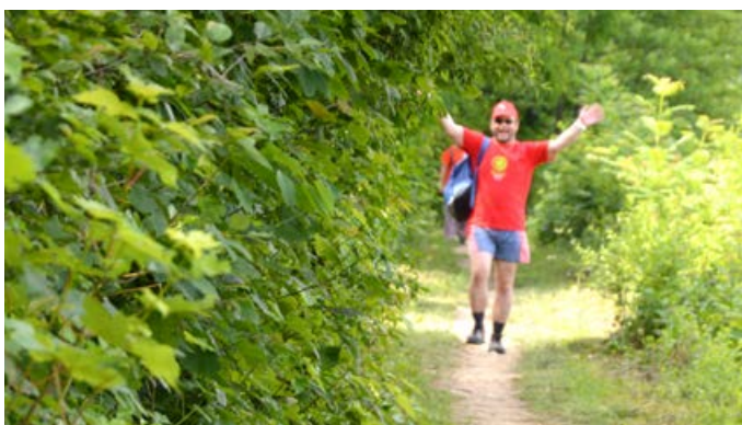
Takole veselo so bili razpoloženi pohodniki ob Kamniški Bistrici.