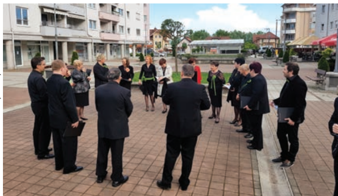
Mešani pevski zbor Ostijarej je zapel kar med trzinskimi bloki.

Prav vsi pevski nastopi so poskrbeli za to, da so poslušalci lahko uživali v ubranem petju, vendar pa pevskega doživetja niso pričarali le obiskovalcem dvorane v Centru Ivana Hribarja. Tokratni dogodek je bil namreč poseben zato, ker so se pevci po končanem dvoranskem nastopu podali po trzinskih ulicah in cestah ter zapeli kar med hišami in bloki. Tako so po zaslugi prizadevnih organizatorjev približali ljubiteljsko kulturo tudi tistim, ki sicer poredko zaidejo v kulturne dvorane. To pa je tudi eden glavnih namenov tedna ljubiteljske kulture: prek kulturnega dogajanja povezati vse prebivalce Slovenije in opozoriti na brezmejno energijo in čas, ki ga številni ljubiteljski ustvarjalci namenjajo za kulturo brez plačila.