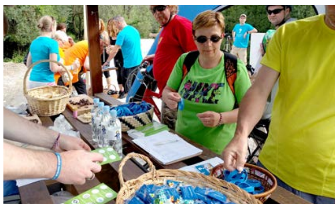
Veseli nas, da so številni pohodniki pohvalili našo Modro točko, kjer so se lahko okrepčali in slikali ter za spomin dobili modro zapestnico.