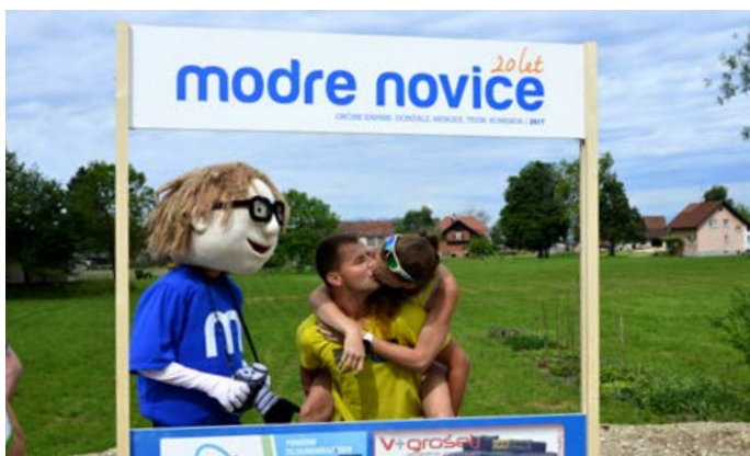
Vsi, ki ste se na Modri točki slikali v velikanski naslovnici, sodelujete v nagradni igri s privlačnimi nagradami.