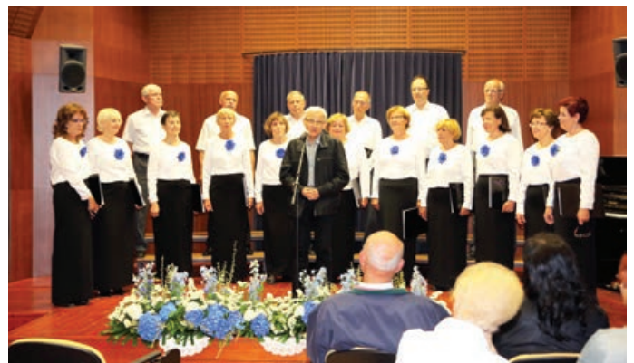
Mešani pevski zbor Žerjavčki in minister za kulturo Tone Peršak

Koncert je obiskal tudi minister za kulturo in nekdanji trzinski župan Tone Peršak, ki je tokrat med svojimi sokrajani prvič nastopil v novi vlogi. Z zbranimi je delil ugotovitev, kako pomembna je ljubiteljska kultura. »Današnja prireditev je le kamenček v mozaiku neverjetnega števila več kot tisoč prireditev, ki ob tednu ljubiteljske kulture potekajo po vsej Sloveniji,« je povedal Peršak in poudaril, da je Slovenija poleg Finske v samem evropskem vrhu po razširjenosti ljubiteljske kulture. »Kako pomembna je ljubiteljska kultura, govori tudi trzinski primer. Trzinci se v preteklosti zaradi naraščajočega priseljevanja nismo dobro poznali, pojavljale so se napetosti, in ravno društva, zlasti kulturna, so nas čvrsto povezala. Danes v pevskem zboru, folklorni skupini, kulturnem društvu ... nastopajo tako ljudje iz novega kot iz starega dela Trzina in obrtne cone. Skozi te dejavnosti se Trzin krepi in postaja celota. Prav povezovanje je ena ključnih vlog ljubiteljske kulture. Ljudje se prek kulture spoznajo in se trudijo za skupni cilj, ki jih poveže,« je izpostavil Peršak in poudaril tudi kakovost tovrstnih prireditev.