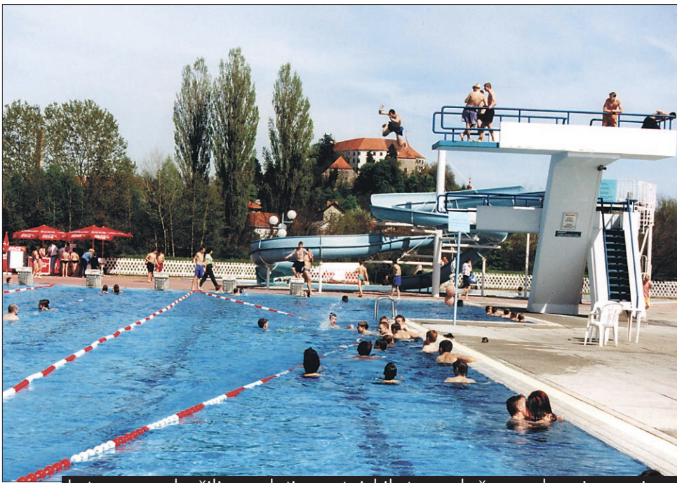
Letos smo skočili v poletje v ptujskih termah že pred prvim majem.