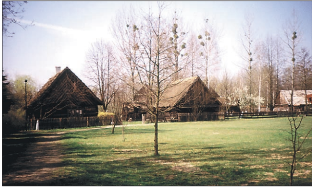
Hiše v vasi, ki je danes lepo urejen muzej