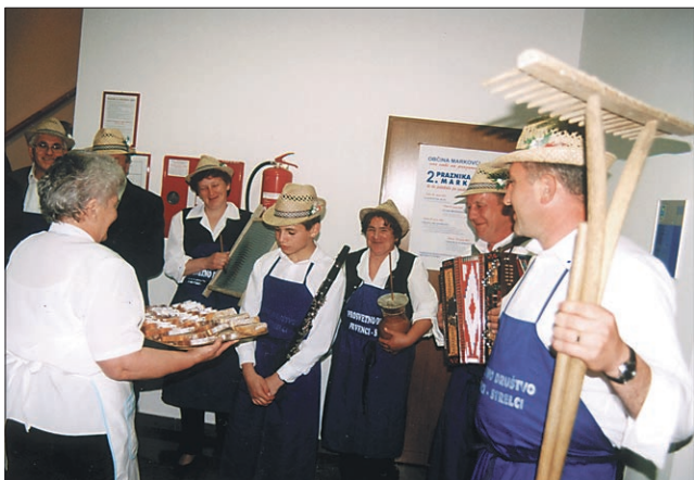
Utrinek z ene od prireditev, posvečenih krajevemu prazniku.

V občini Markovci so minuli teden, na god farnega zavetnika sv. Marka, praznovali že drugi občinski praznik. V dveh letih, odkar imajo samostojno občino,