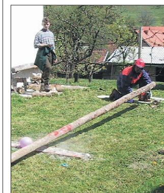
Deblo je padlo tik ob balonu