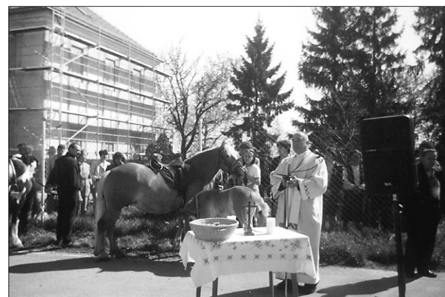
Tradicionalni blagoslov konj na Runču.

Zavetnik konj je sveti Jurij in na dan njegovega godovanja 24. aprila ali pa vsaj okrog tega praznika marsikje blagoslovljajo konje.