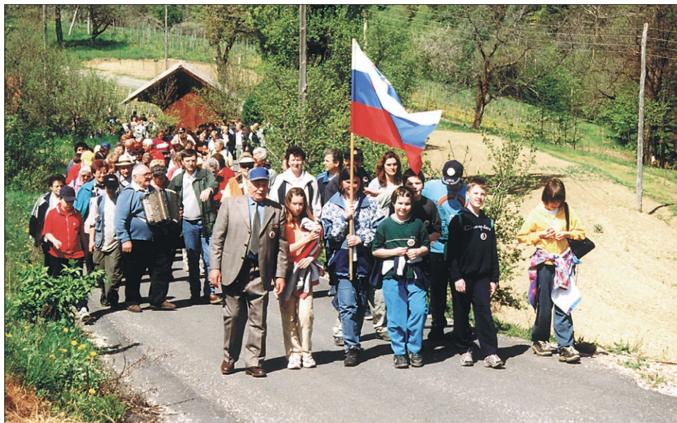
Udeleženci 5. pohoda po poteh Upora in prostovoljnega dela na poti proti Kicarju.