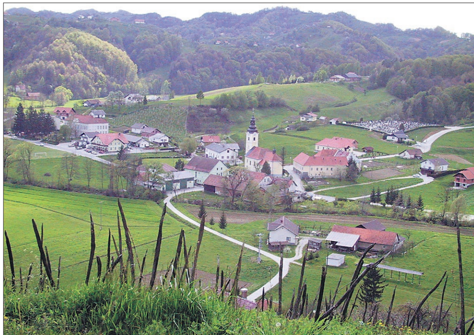
Pogled na središče KS Leskovec z enega od okoliških hribov

doči evropski meji razvojno stagniral ali celo nazadoval. Kar dobra tretjina prebivalcev še nima vodovoda. To bi bil navidezno lahko rešljiv problem, če ne bi bilo potrebno zgraditi kilometrov in kilometrov primarnega omrežja. Brez vode so trenutno v Veliki Varnici, Gradišču, Skorišnjaku, delu Okiča in Belavšku. V Belavšek bo z uresničnim projektom lanskega in letošnjega leta voda pritekla v bližnji prihodnosti, nato naj bi bili na vrsti Skorišnjak, Okič in Gradišče. Beseda nato je terminsko povsem nejasno opredeljena, saj je vprašanje financiranja še nedorečeno. Celotni projekt primarnega voda je po cenah, ki danes ne držijo več, ocenjen na 110 milijonov tolarjev, že primarni vod do Belavška pa je pobral 51 milijonov tolarjev. Gradnja vodovoda v Halozah je izredno draga. Vsak od 55 priključkov v Belavšku bo stal krepko nad milijon tolarjev in to ob dejstvu, da je vodohran že zgrajen. Za omenjeni Skorišnjak so pomoč pričakovali že v letošnjem letu, država ga je celo obljubila, žal pa občina v