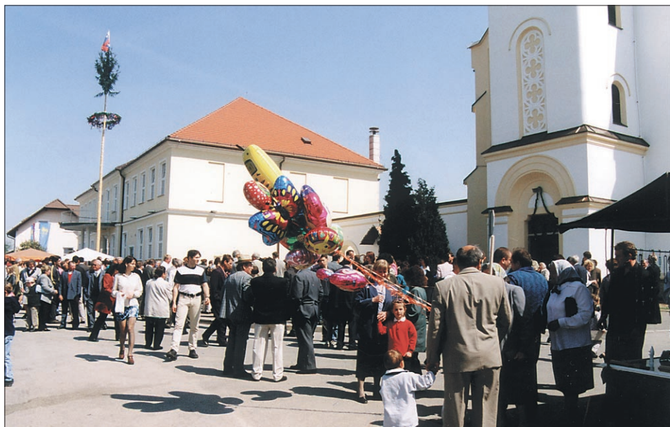
Na Markovo nedeljo je bilo v Markovcih tradicionalno žegnanje in slavnostna maša