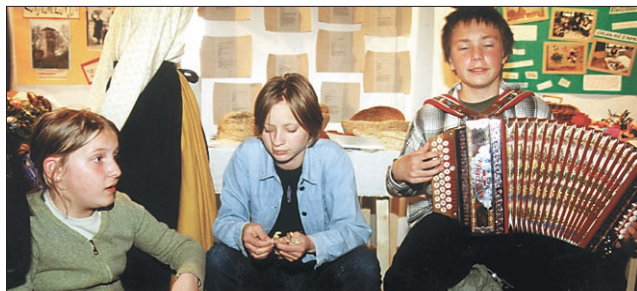
V Miheličevi galeriji se je na razstavi predstavilo vseh 39 šol. Najboljša je bila OŠ Zreče.