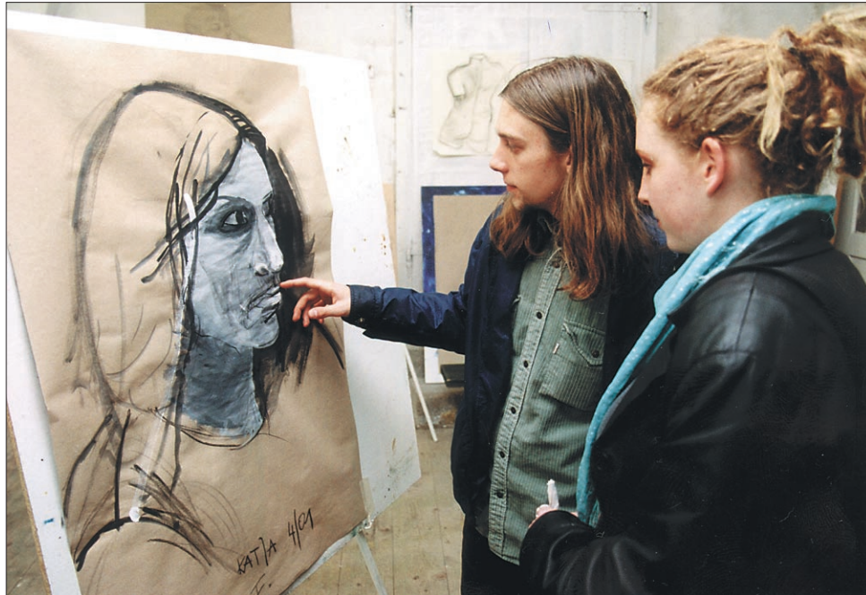
Z razstave risb udeležencev začetnega tečaja risanja pod vodstvom akademskega slikarja Tomaža Plavca .

V stari steklarski delavnici, kjer ima od nedavnega svoj slikarski atelje najmlajši akademsko izobražen ptujski slikar Tomaž Plavec , so 13. aprila odprli razstavo risb udeležencev začetnega risarskega tečaja pod njegovim vodstvom.