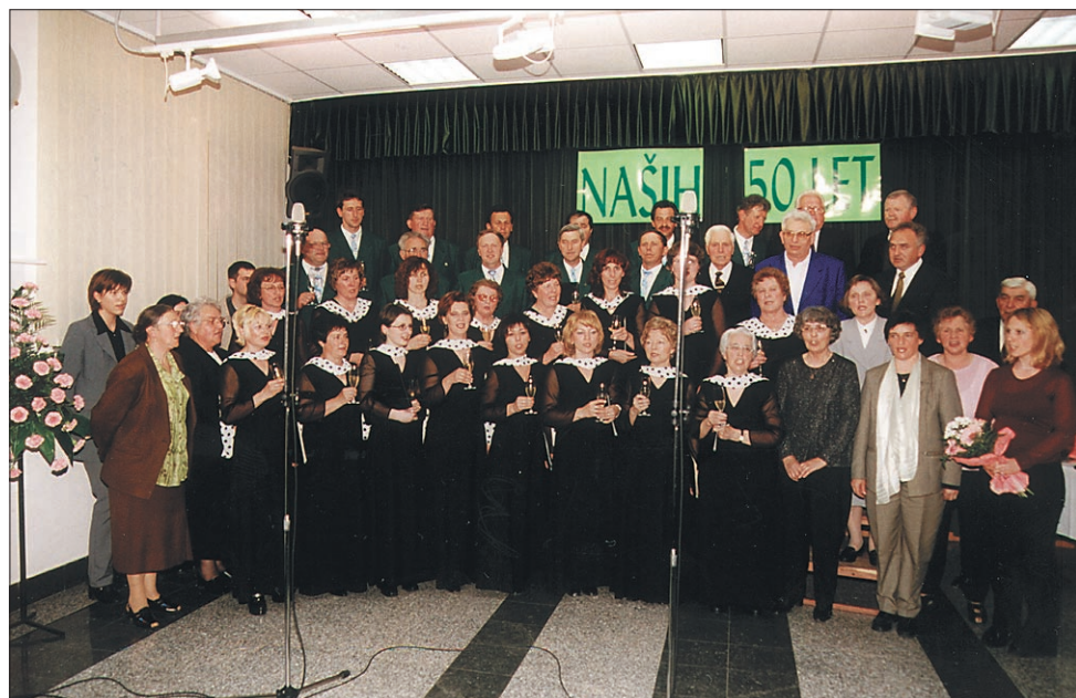
Ko so si pevci - jubilarji na koncu nazdravili s pesmijo, so se jim pridružili tudi vsi tisti obiskovalci koncerta, ki so nekoč peli v videmskem zboru.

TINJE / 21. REVILJA ODRASLIH FOLKLORNIH SKUPIN