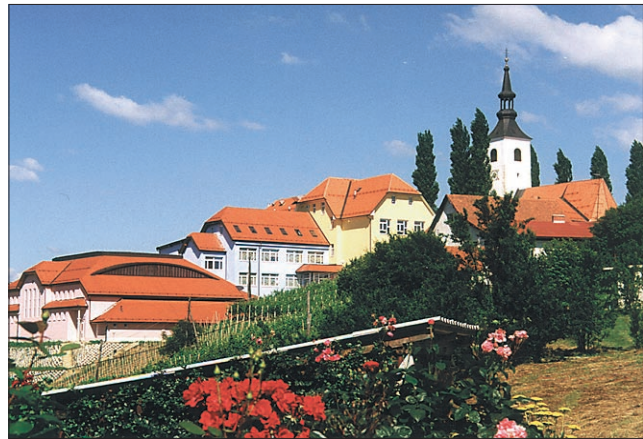
Destrniška osnovna šola je po porabi energije najbolj varčen objekt v državi