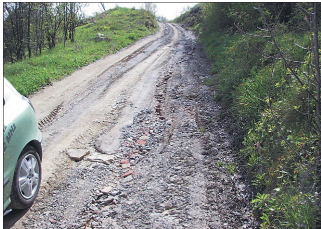
Gramoziranje strmih cest je nesmisel, saj voda vedno znova spira gramoz in ceste kažejo gola lapornata rebra

Območje sedanje KS Leskovec bo kot samostojna občina, kot del občine Videm ali v prihodnje kake druge, morda povezane haloške občine, potrebovalo več državnega poslušala in sredstev. Da se ne bi zgodilo, da bi ta del Haloz ob zeleni bo-