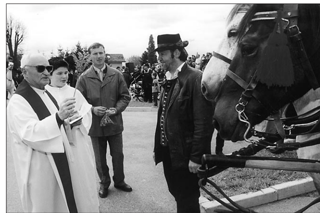
Prvi blagoslov konj pri cerkvi Leopolda Mandiča.