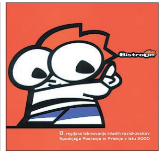
Bistroum - nov zaščitni znak mladinskega raziskovalnega dela

Projekt mladinskega raziskovalnega dela je eden najbolj