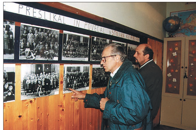
Zanimiva razstava starih fotografij in šolskih predmetov