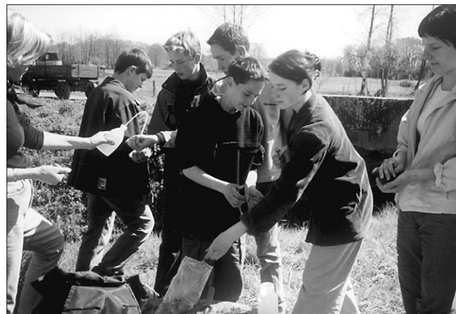
Merjenje kakovosti vode v Studenčnici - projektna skupina predmetne stopnje.

pedagoške fakultete Maribor in predstavniki Zavoda za šolstvo - enote Maribor. Na okrogli mizi so sodelovali tudi učenci, ki so sodelovali v projektu, zunanji