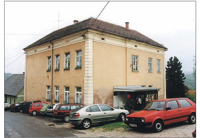
Zgradba šole na Ptujški Gori je stara že 100 let

Do leta 1919 se je število otrok na Ptujški Gori gibalo med 230 in 260, šolo pa jih je obiskovalo 190, saj so bili nekateri prerevni, drugi preslabotni. Nekaj naslednjih let je število učencev padalo, a se je po letu 1930 spet pričelo dvigovati, tako da je bilo leta 1940 že 237 učencev. V šolskem letu 1940/41 je bil zadnji