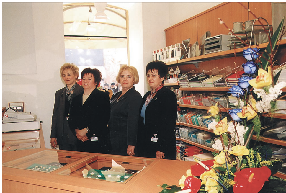
Galanterija in papirnica v novi preobleki.