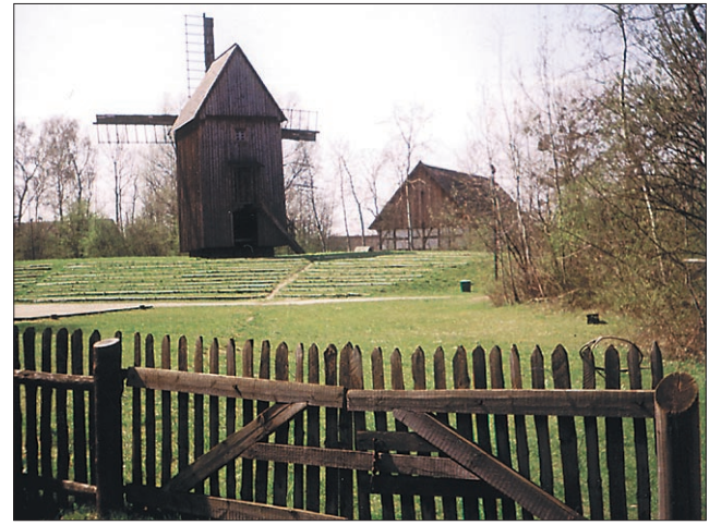
Mlinar je užival poseben ugled. Mlin je tudi v notranosti dobro ohranjen