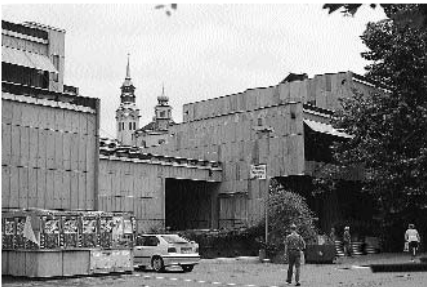
8. Edvard Ravnikar: Ljubljana – Trg republike; 1960–1974) pogled na objekte ob Erjavčevi ulici

Na natečaju je zmagal Ravnikar s projektom, ki pomeni šolski primer corbusianskega urbanizma tipa Plan Voisin. Veliko ploščad, ki zavzema celoten prostor vrta, naj bi uredili v osi sever–jug z dvema visokima stolpnicama v obliki prizem. V eni stolpnici naj bi bil sedež vlade, druga je bila namenjena »slovenskemu gospodarstvu«. Stolpnici naj bi imeli simbolno vlogo gigantskega slavloloka zmage, podobno kot jo ima pariška La Defense. Prostor med stolpnicama in že zgrajenim poslopjem skupščine (arhitekt Vinko Glanz, 1954–1958) naj bi bil namenjen množičnim zborovanjem, med njima naj bi stal spomenik, posvečen dvajseti obletnici zmage revolucije. Novi kompleks naj bi programsko dopolnila stavba veleblagovnice.