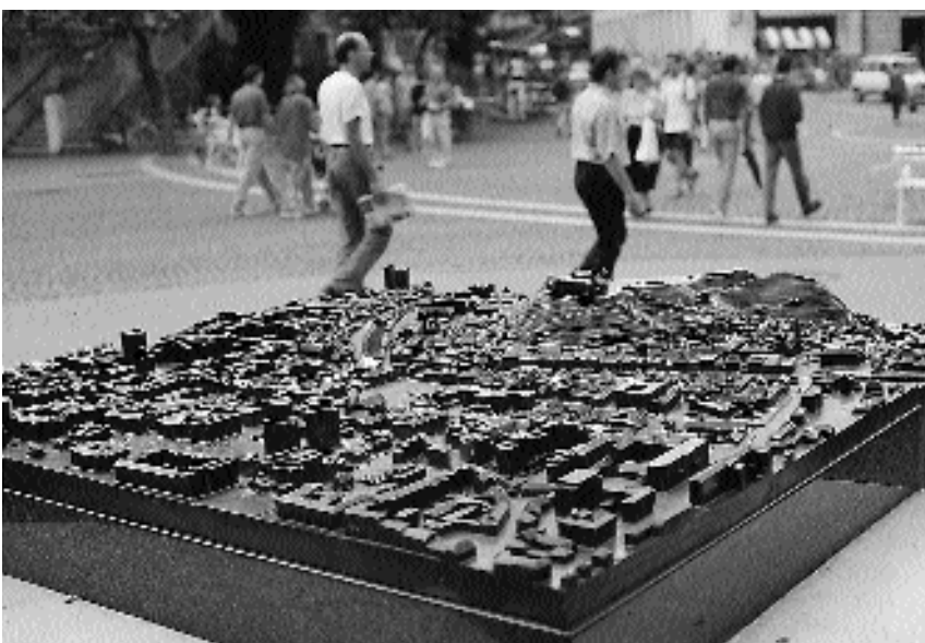
6. Maketa ljubljanskega mestnega središča na Prešernovem trgu