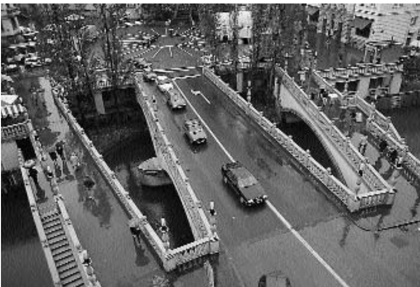
4. Jože Plečnik: Ljubljana – Tromostovje (1929–1933)