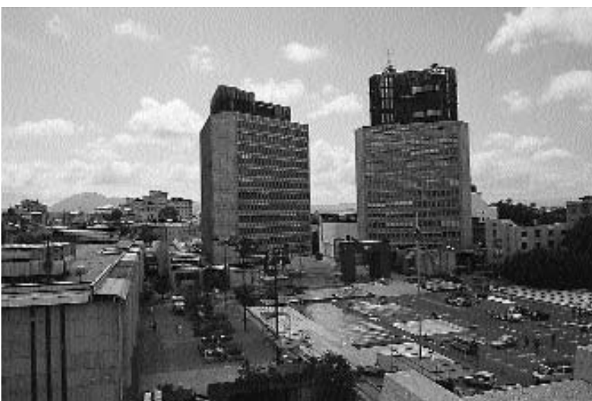
7. Edvard Ravnikar: Ljubljana – Trg revolucije, danes Trg republike; (1960–1974) pogled na celoto