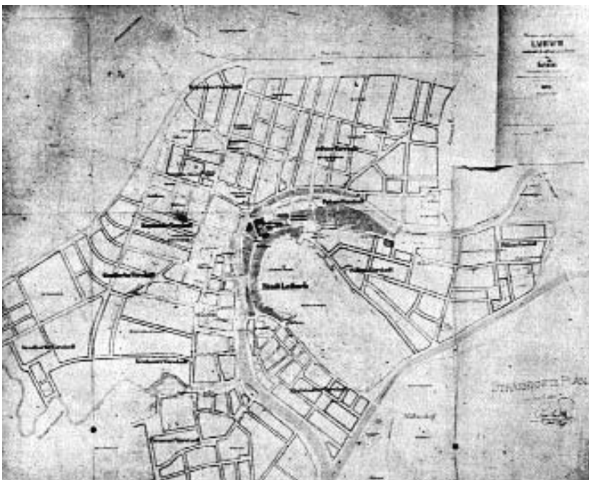
1. Camillo Sitte: Regulacijski načrt Ljubljane, 1895

kem zasebnem pismu opisal, kako je po Wagnerjevih navodilih sodeloval pri pisanju te knjige. 3