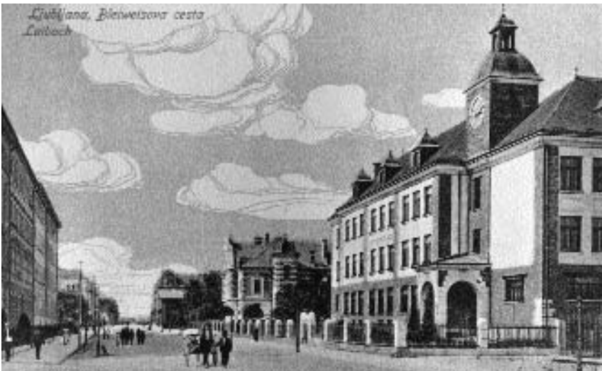
3. Ljubljana: Pogled na nekdanjo Bleiweisovo, sedanjo Prešernovo cesto

spremembe uličnih črt predvsem tam, kjer so bile stavbe v lasti mestne občine oziroma kjer je potres stavbe tako razmajal, da je bilo potrebno njihovo rušenje. Stališče mestnih veljakov je bilo, »...da je sedaj nastala prava doba za regulacijo Ljubljane in da bi bila večna škoda, ko bi mestna uprava prilike ne izrabila, da mesto modernizira.« 5 Pri osrednjih oblasteh so izposlovali ugodna posojila in davčne olajšave za vse, ki so bili pripravljene podreti svoje poškodovane hiše in na istih mestih ali drugje zgraditi nove. 6 Tako so po nepotrebem porušili tudi marsikatero stavbo, ki bi se jo dalo zlahka popraviti. Med njimi je bila žrtvovana poznorenesančna rezidenca knezov Auerspergov, tako imenovani knežji dvorec, ki bi, če bi bil ohranjen, pomenil enega ključnih arhitekturnih spomenikov Ljubljane.