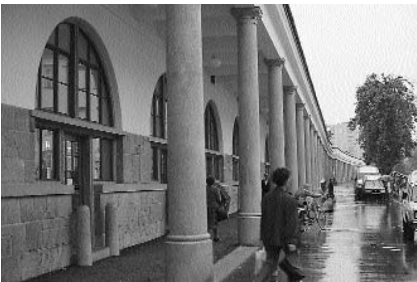
5. Jože Plečnik: Ljubljana – Ljubljanske tržnice (1939–1944)