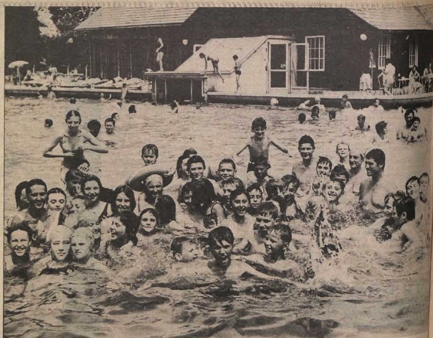
Skupina brežjskih osnovnošolcev v nadaljevalnem plavalnem tečaju v Čateških Toplicah, ki se je končal s tekmovanjem vseh udeležencev v soboto, 8. julija. Učence osnovne šole bratov Ribarjev so učili