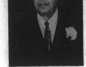
V BLAG SPOMIN TRETJE OBLETNICE SMRTI NAŠEGA PRELJUBLJENEGA IN NIKDAR POZABNEGA OČETA