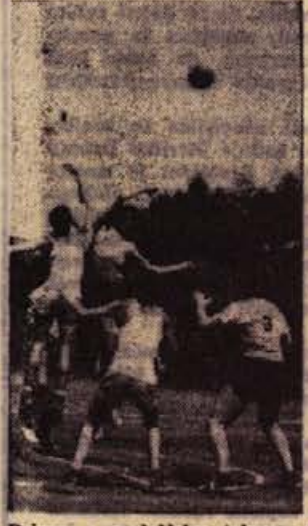
Prizor z nedeljske tekme v košarki na Lokih: uvodni skok za žogo. Čigava bo?

17. junija bi morala biti rokometna tekma med krmejskimi in krškimi rokometiščem. Vendar krških rokometiščem ni bilo v Krmeji. Ker svojega izostanka niso opravičili in ker se je zgodilo že tretjič zapored, da so krmejski igralci zaman pričakovali goste, krškimi igralcem to ne more biti v ponos in ugled. D. B.