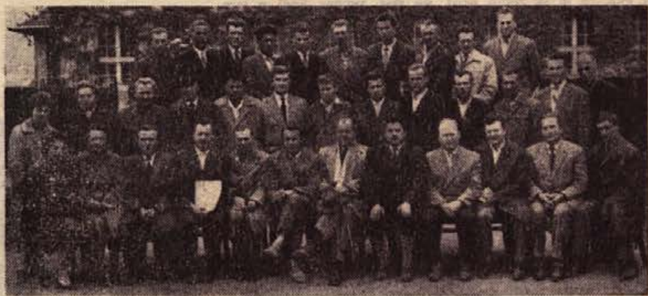
9. junija je bil končan tridnevni seminar za predsednike sindikalnih podružnic v brežiški komuni. Udeležilo se ga je 33 predsednikov, ki so bili zelo zadovoljni s predavanji. Nekatera podjetja pa so že naprosila občinski sindikalni svet, da bi podobna predavanja priredil tudi za vse organe delavskega samoupravljanja. Delavski svet tovarne pohištva v Brežicah je sklenil pričeti s predavanji 13. junija, medtem ko bodo taka predavanja v Dobovi za vsa podjetja hkrati. — Na sliki: udeleženci seminarja za predsednike sindikalnih podružnic.

Nedaleč od vasi Zapudje je studenec. V Zapudju pa ob sušnih letih občutno primanjkuje vode. Zato so vaščani sklenili, da bodo studenec zajezili. »Nič ne bomo moletovali in prosili okrog, sami bomo zgradili to zajetje,« tako so se pogovarjali. Posebna zasluga za zamisel gre domačim gasilcem. Zaposlili so gradbenega strokovnjaka, da jim bo napravil načrt, in drugega, ki bo nadziral, delali pa bodo sami.