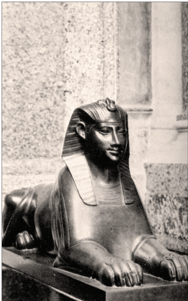
Slika 2: Sfinga , Galleria Borghese, Rim.