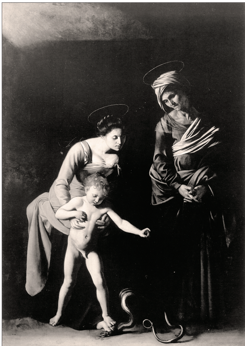
Slika 7: Caravaggio, Madona dei Palafrenieri , 1605, Galleria Borghese, Rim.