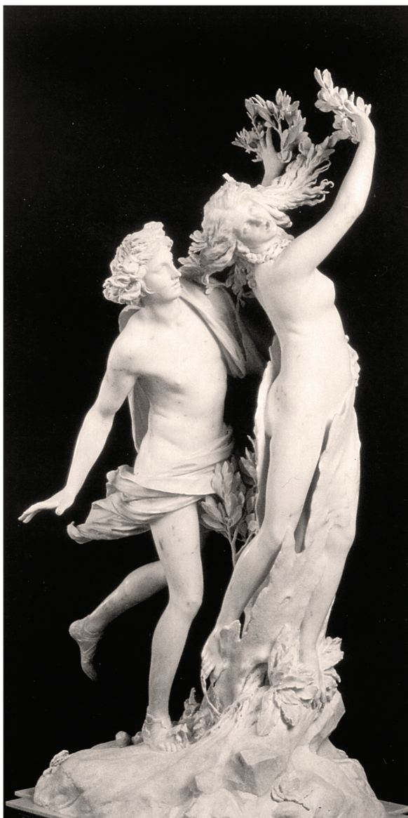
Slika 1: Gian Lorenzo Bernini, Apolon in Dafne , 1622–1625, Galleria Borghese, Rim.