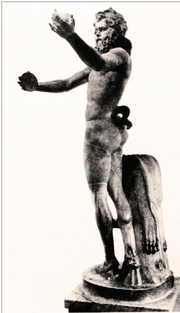
Slika 6: Satir , Galleria Borghese, Rim.