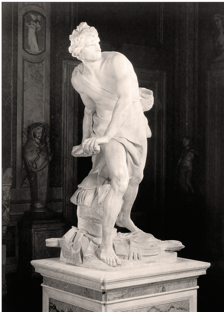
Slika 3: Gian Lorenzo Bernini, David , 1623–1624, Galleria Borghese, Rim.