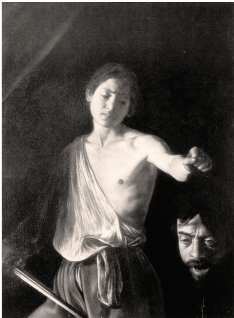
Slika 9: Caravaggio, David , 1609–1610, Galleria Borghese, Rim.