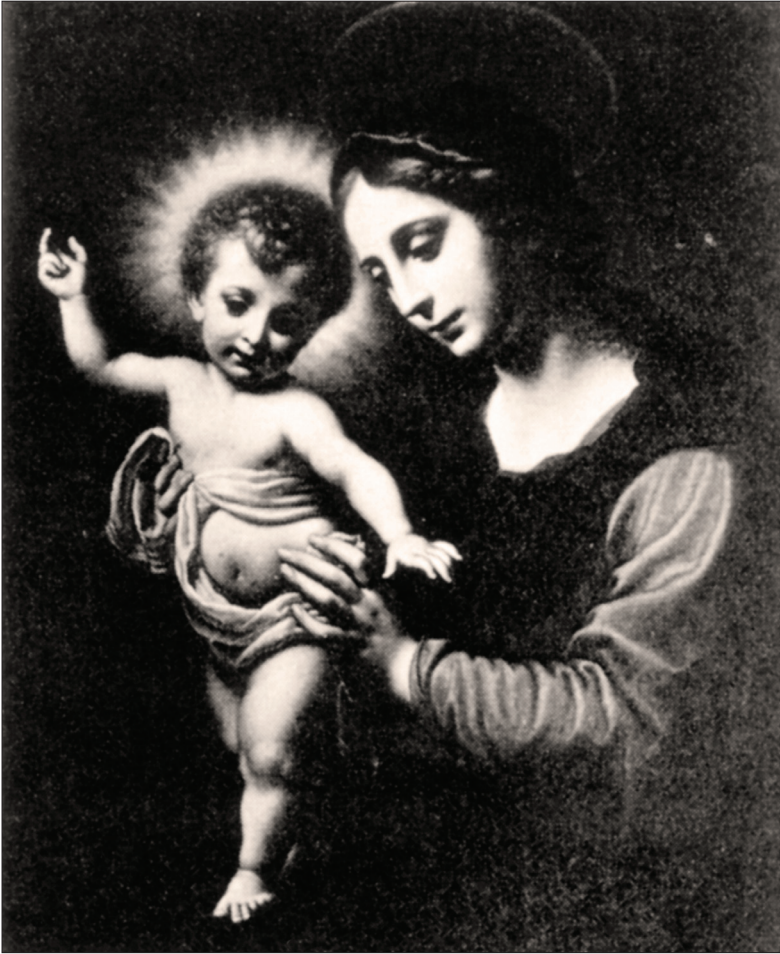
Slika 8: Carlo Dolci, Madonna col Bambino , Galleria Borghese, Rim.