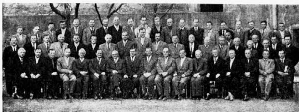
Delegati na občnem zboru celjskega čebelarskega društva 12. aprila 1959